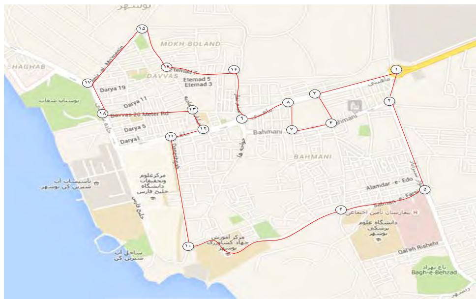
شکل شماره ۲: مسیر بهینه انتخاب شده

مدل ریاضی ارائه شده با استفاده از نرم‌افزار لینگو کد نویسی شد و سریع‌ترین مسیر ممکن برای ارزیابی همه این مناطق توسط تیم ارزیاب به دست آمد. مطابق نتیجه، از بین ۲۸ مسیر موجود بین ۱۸ گره، ۱۸ مسیر انتخاب شد که تیم ارزیابی می‌تواند با طی کردن این مسیر در کوتاه‌ترین زمان همه نقاط را ارزیابی کند. هوانگ و همکاران نیز در سال ۲۰۱۳ پژوهش مشابهی انجام دادند.