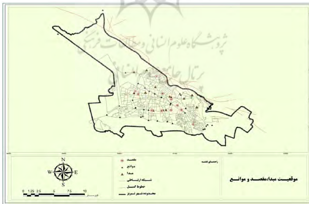
نقشه شماره ۲: پراکندگی مبدأ، مقصد و موانع در سطح شهر تبریز