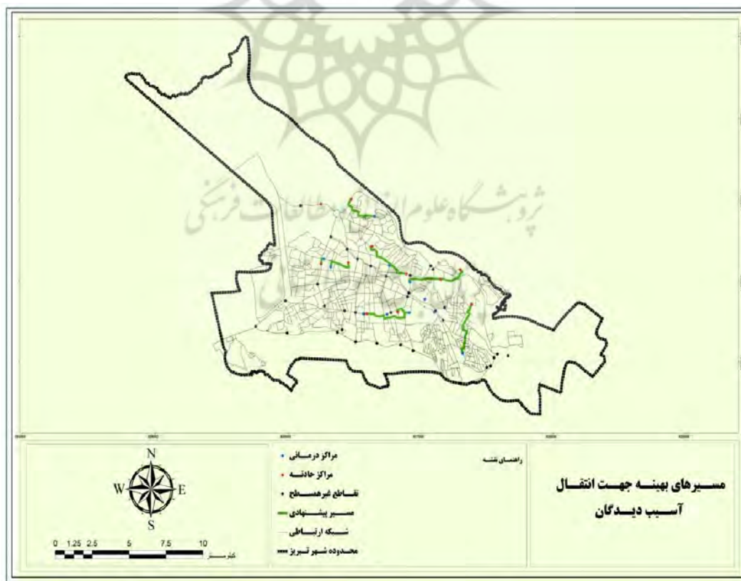
نقشه شماره ۳: خروجی نهایی مدل