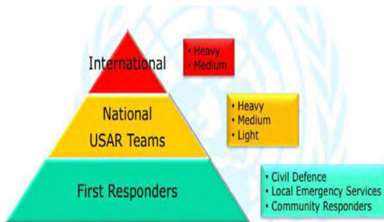
شکل شماره ۱: سطح بندی تیم های جستجو نجات شهری INSARAG (۵)