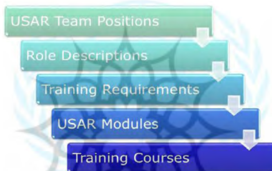
شکل شماره ۲: متدولوژی آموزشی INSARAG (۵)