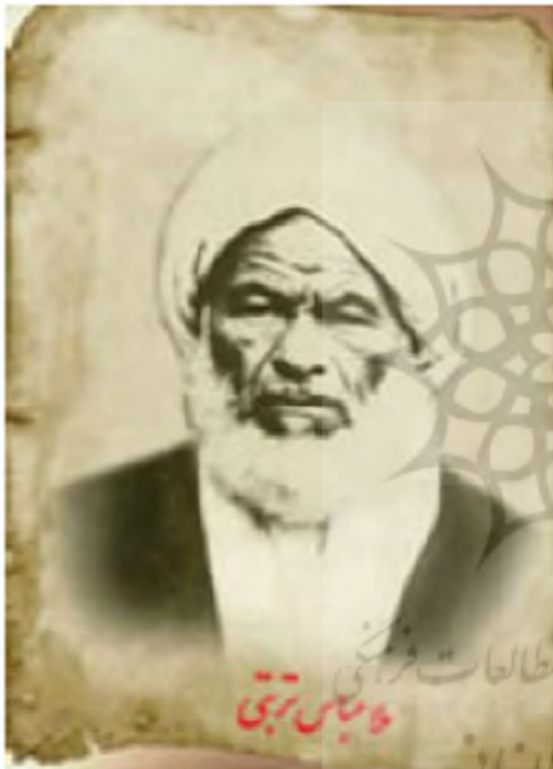
آخوند ملا عباس تربتی

ناله‌کنان به کوچه، خیابان و بیابان وارد شوند، این در حالی بود که باران نیز به شدت می‌بارید.