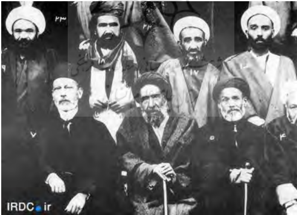
مؤمن‌الملک و سیدحسن مدرس