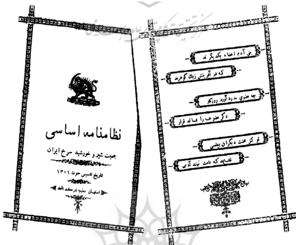
تصویر جلد اساسنامه جمعیت ۱۳۰۱

جنگ با امراض ساریه در صحیه عمومی و رفع امراض محلی که مخصوص به بعضی اماکن است و مرض حصبه و سل در موارد قحطی و زمستان‌های سخت و مطلقاً در تسکین آلام و اسقام ضعفا و دستگیری از فقرا مساعی خود را مبذول خواهد داشت. جمعیت شیر و خورشید سرخ در جمع‌آوری و تعلیم و تربیت اطفال یتیم بی‌بضاعت و نگهداری از ارامل و پرورش اطفال رضیع بی‌باعث ساعی و جاهد بوده و برای انجام مقصود نوع‌پرورانه هیأت‌هایی را در مرکز تربیت کرده و به اطراف و اکناف مملکت گسیل خواهد داشت، علاوه بر مریض‌خانه‌های ثابت و سیار و تأسیس مدارسی برای ایتام، جمعیت شیر و خورشید سرخ در ایجاد