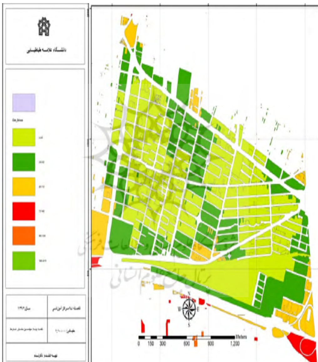
شکل شماره ۳: توزیع مراکز آموزشی امن محله برای اسکان اضطراری پس از زلزله

در ضوابط طراحی برای مراکز آموزشی ابتدایی سطح کل زیربنا از ۴۰ درصد سطح کل زمین نباید تجاوز کند و حداقل سطح آزاد ۶۰ درصد سطح زمین باشد. در مدارس راهنمایی حداکثر سطح کل زیربنا در طبقات از ۵۰ درصد تجاوز نکند و در دبیرستان‌ها زیر بنا نباید از ۴۰ درصد سطح کل زمین تجاوز کند (۱۷). در محدوده مورد مطالعه ۳۰ درصد مراکز آموزشی دارای فضای باز کافی و ۹ درصد آنها دارای فضای باز با مساحت کم می‌باشند. سایر مراکز فاقد فضای باز هستند.