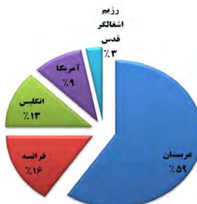
نمودار شماره ۱- درصد فراوانی تولید علم به تفکیک