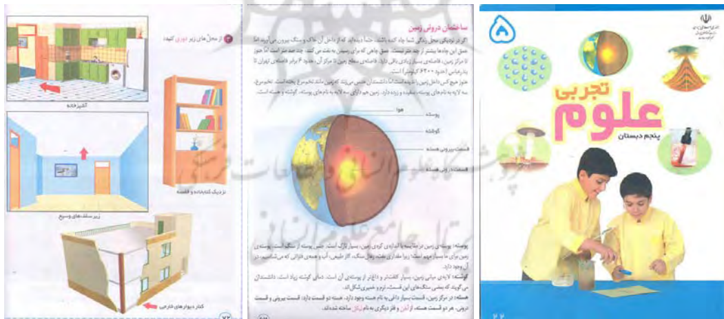
شکل شماره ۲: کتاب علوم پنجم دبستان "زمین ناآرام"