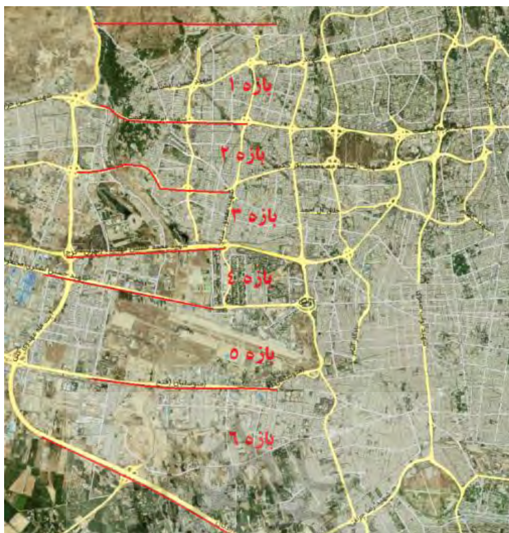
شکل ۳. موقعیت کریدور رودخانه‌ای کن در کلان‌شهر تهران در تقاطع با شریان‌های ارتباطی اصلی قطع‌کننده