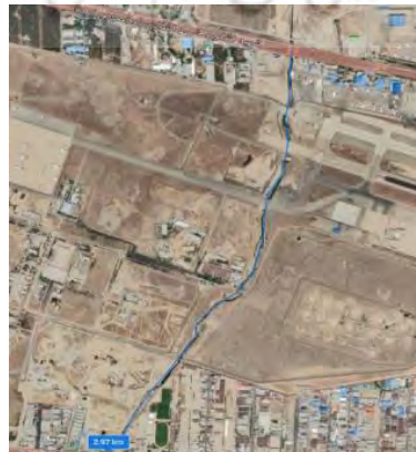
بازه ۵، اتوبان شهید لشگری تا اتوبان فتح