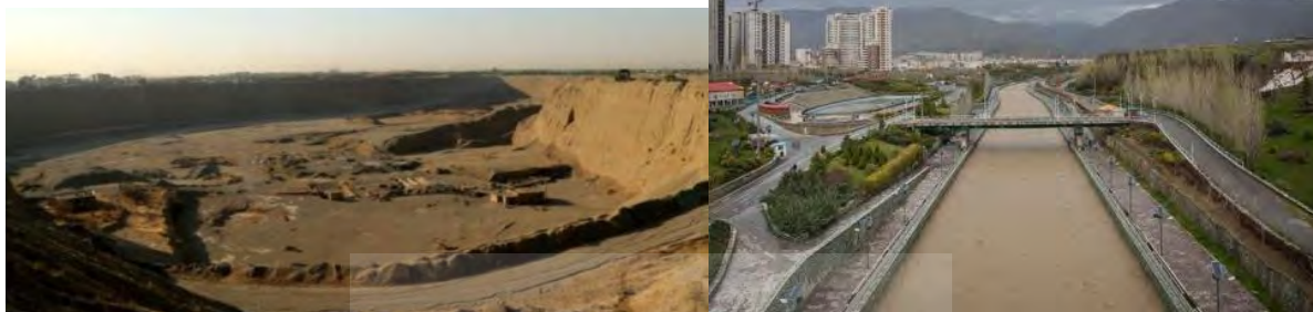
شکل ۱. نمونه‌هایی از تغییرات در بستر رودخانه کن (کانالیزه کردن و بتنی کردن بستر، تغییر حالت طبیعی حاشیه‌ها و حریم رودخانه، پله‌بندی بستر، برداشت شن و ماسه و ایجاد شن‌چاله‌ها در مسیر کریدور رودخانه‌ای کن در تهران

دهند. کریدورهای رودخانه‌ای می‌توانند حساس‌ترین و آسیب‌پذیرترین اکوسیستم‌های شهری باشند و یا در عین حال، پشتوانه‌ای برای مدیریت صحیح، پایداری و تعادل چشم‌انداز شهری باشند. رودخانه‌های شهری یکی از اکوسیستم‌هایی هستند که به دلیل مداخلات نسنجیده و غیر علمی انسانی مورد تخریب و دست‌کاری قرار گرفته‌اند.