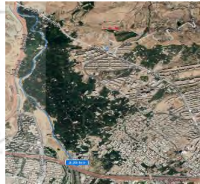
بازه ۳، اتوبان علامه جعفری تا شهید فهمیده