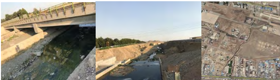
شکل ۸. مسیر بازه ۵ و نمونه‌هایی از تغییرات مصنوعی در آن