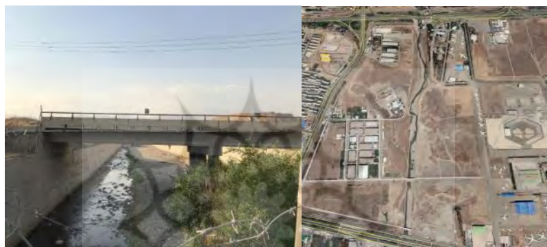
شکل ۷. مسیر بازه ۴ و نمونه‌هایی از تغییرات مصنوعی در آن

مسیر رودخانه در این بازه چندین بار به صورت مصنوعی تغییر کرده و تغییر جهت داده است. طرفین بستر در بیشتر قسمت‌ها با دیواره چینی محصور و محدود شده است. رودخانه در این بازه از نوع محدودشده، تکرشته‌ای، با مورفولوژی شریانی و بستر آبرفتی است. وجود پوشش گیاهی در حاشیه بستر با طول و پهنای نسبتاً مناسب در آن مشهود است. رودخانه در این قسمت جریان پایهای اندکی دارد (شکل ۸). با توجه به خصوصیات بازه، ارزیابی کیفیت مورفولوژیکی بازه امتیاز ۰/۵۱۸ را نشان می‌دهد و بنابراین، این بازه در گروه با کیفیت متوسط ارزیابی می‌شود.