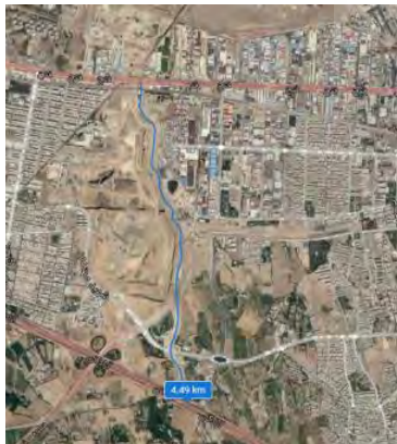
بازه ۴، اتوبان شهید فهمیده تا اتوبان شهید لشگری