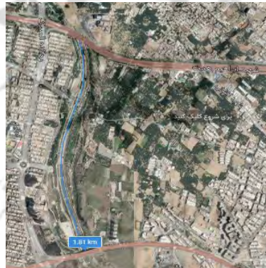
بازه ۲، اتوبان همت تا اتوبان علامه جعفری