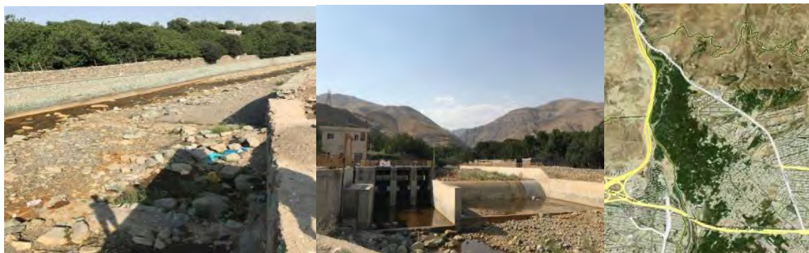
شکل ۴. مسیر بازه ۱ و نمونه‌هایی از کانالیزه کردن و تغییرات مصنوعی در آن