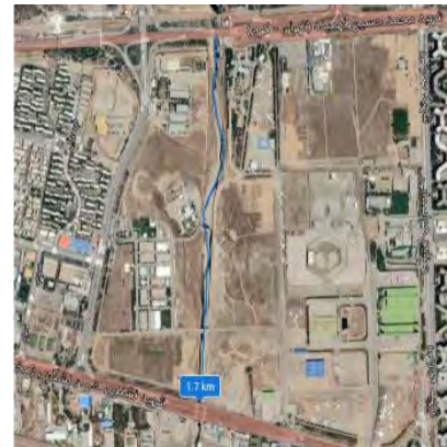
بازه ۶، از اتوبان فتح تا آزادراه آزادگان