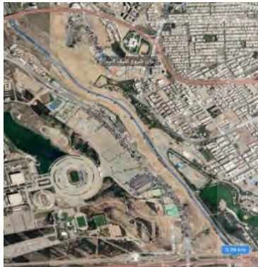
بازه ۱، ابتدای رودخانه کن تا اتوبان همت