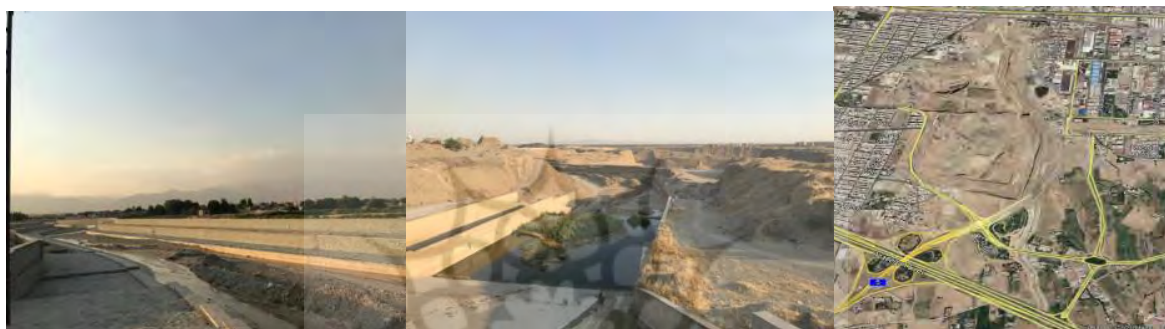
شکل ۹. مسیر بازه ۶ و نمونه‌هایی از تغییرات مصنوعی در آن

(همچون ۱۲ فروردین ۱۳۹۸) و تشدید سیلاب در پایین دست خواهد شد. گذشته از مسائل و مشکلات طرح شده در یادشده، یکی از مسائل دیگر رودخانه‌های شهری در حوزه مدیریت و برنامه‌ریزی، فقدان متولی اصلی و نقش و مداخله سازمان‌های مختلف است. این مهم در شهر تهران نیز منجر به بروز مشکلات متعدد در خصوص شیوه بهره‌برداری و تعیین حریم رودخانه و چگونگی پیوند فضای شهری با فضای حریم رودخانه می‌شود. این موضوع در خصوص رودخانه کن، به دلیل هم‌جواری کاربری‌های نظامی و فرودگاه در محدوده مناطق ۹ و ۲۱ و همچنین، بهره‌برداری از منابع شن و ماسه و تغییرات در سیستم رودخانه به وسیله سازمان‌های مختلف دارای آثار منفی مضاعفی است. برای ایجاد بستر مدیریت شهری واحد، پیشنهاد می‌شود با تأسیس سازمانی واحد، نسبت به ساماندهی رودخانه‌های شهری تهران مبادرت شود. این موضوع در صورت اجرای صحیح، می‌تواند الگوی سایر شهرهای دارای رودخانه شهری شود. بخشی از مشکلات رودخانه کن ناشی از کانالیزه کردن بستر آن است که می‌توان با بازگرداندن بستر به شکل طبیعی یا نزدیک به طبیعی، ضمن امکان ایجاد تبادل و تغذیه سفره آب زیرزمینی از شدت انتقال آب به پایین کریدور نیز جلوگیری به عمل آورد. در این خصوص، بازطراحی و احیای مسیر طبیعی رودخانه مفید خواهد بود.