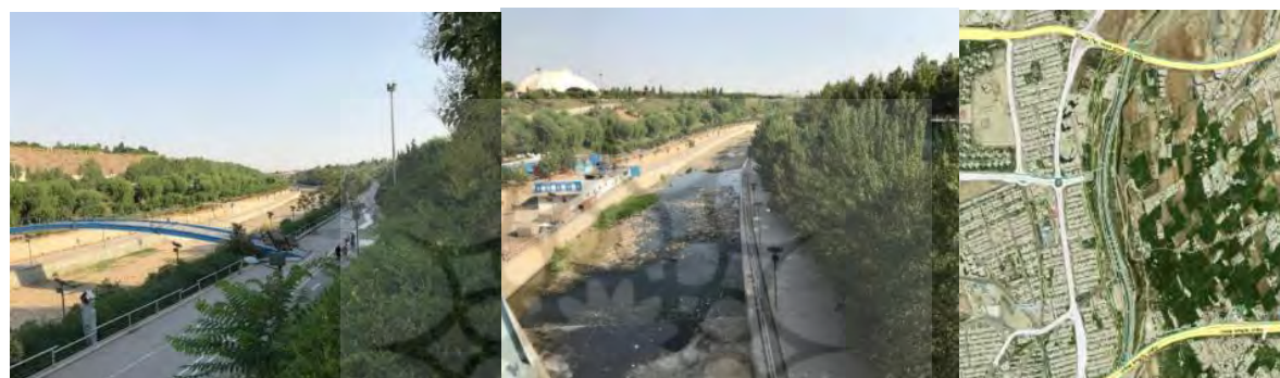
شکل ۵. مسیر بازه ۲، بوستان جوانمردان و نمونه‌هایی از کانالیزه کردن و تغییرات مصنوعی در آن

کامل شکل‌های بستری، نبود شکل‌های آبرفتی، فقدان پوشش گیاهی طبیعی حاشیه‌ای با پهنا و طول مناسب است (شکل ۵). ارزیابی کیفیت مورفولوژیکی در این بازه معادل ۰/۰۲۶ و بازه به صورت بسیار ضعیف ارزیابی می‌شود.