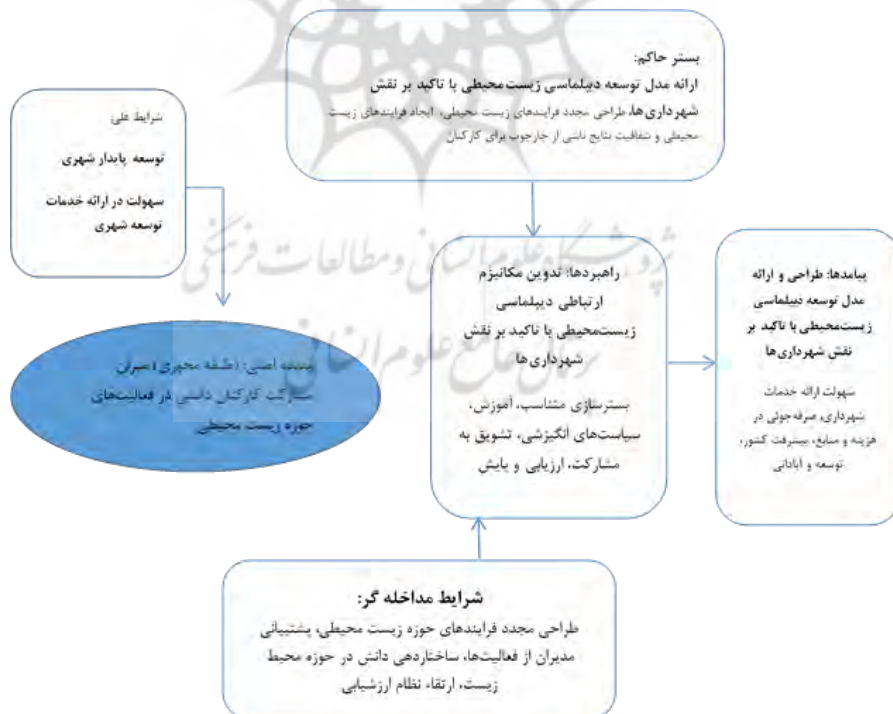
شکل ۱. کدگذاری محوری براساس مدل پارادایم

کوربین و استرواس (۲۰۰۸)، برای ارزش‌یابی پژوهش‌های مبتنی بر نظریه‌پردازی داده‌بنیاد، به جای معیارهای روایی و پایایی، معیار مقبولیت را پیشنهاد داده‌اند. مقبولیت یعنی یافته‌های پژوهش، تا چه حد در انعکاس تجارب مشارکت‌کنندگان، پژوهگر و خواننده در مورد پدیده مورد مطالعه، موثق و قابل باور است. ۱۰ شاخص برای معیار مقبولیت معرفی شده است که ۵ مورد از آنها در این پژوهش برای ارتقای دقت علمی و روایی و پایایی، استفاده شد. استراتژی‌های ممیزی استفاده‌شده، عبارت بودند از حساسیت پژوهشگر، انسجام روش‌شناسی، متناسب کردن نمونه، تکرار شدن یک یافته و استفاده از بازخورد مطلعان.