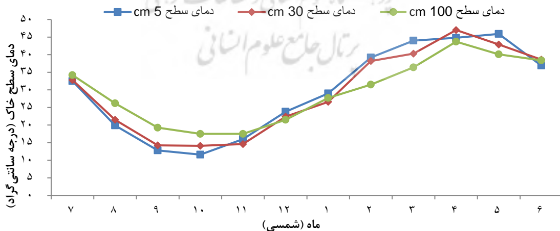
شکل ۴. دمای سطح خاک