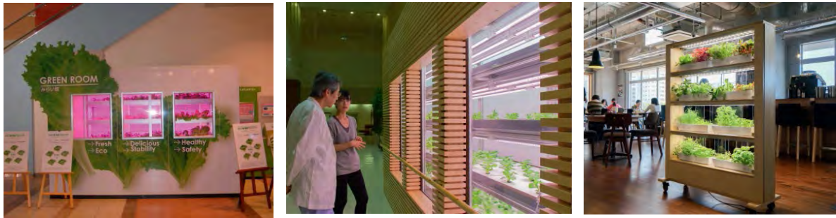
شکل ۱. به کارگیری گل‌خانه‌های کوچک با نور مصنوعی در رستوران‌ها، بیمارستان‌ها و مدرسه‌ها (کوزایا، ۲۰۱۲)

صنوعی و با شرایط محیطی کنترل‌شده برای رشد گیاه است. در شکل ۲، تصویری از سه نوع گل‌خانه تاریک رومیزی در لابراتوار مهندسی انرژی‌های تجدیدپذیر دانشگاه شهید بهشتی نشان داده شده است. مطابق شکل ۲، این سامانه دارای اجزای مختلف از جمله سازه، چراغ‌های ال‌ای‌دی رشد گیاه، سنسورهای اندازه‌گیری دما، رطوبت و شدت نور و واحد کنترل رشد است. هریک از این اجزا در ادامه توصیف شده است.