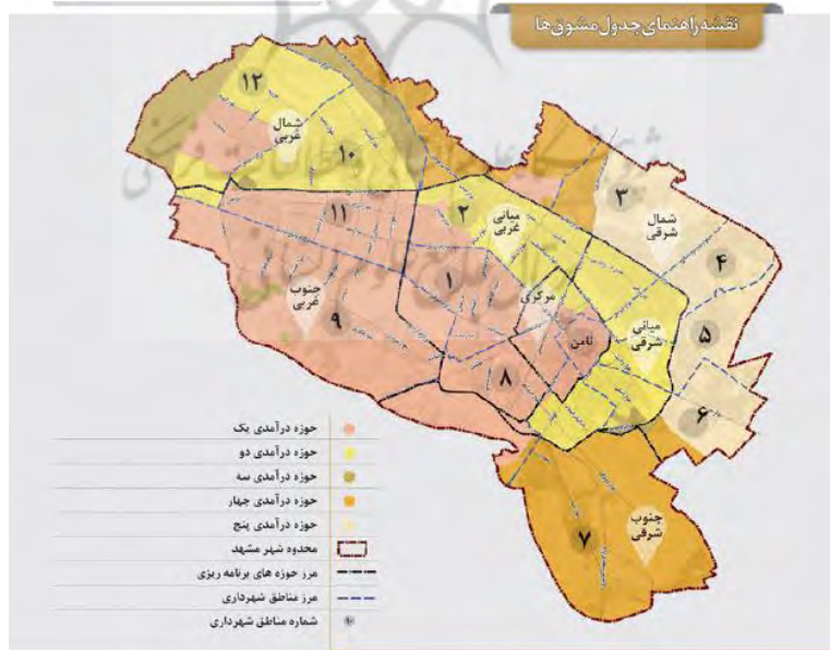
شکل ۱. نقشه راهنمای جدول مشوق‌ها در سرمایه‌گذاری مسکن در شهر مشهد

طرح اقدام ملی تولید مسکن براساس دستور رئیس‌جمهور به همه دستگاه‌های کشور مبنی بر اینکه باید همه زمین‌های مازاد در اختیار وزارت راه و شهرسازی برای تولید مسکن واگذار شود، با هدف بسترسازی و فراهم آوردن زمینه رونق تولید در حوزه مسکن و ساختمان و جبران تولید عقب‌ماندگی سال‌های گذشته برنامه‌ریزی آغاز شد. رونق اقتصادی، ایجاد و افزایش اشتغال در بخش‌های مرتبط از جمله صنعت، تولید و خدمات از دیگر اهداف اجرای این طرح در کشور معرفی شده است. علاوه بر موضوعات کلی یادشده، یکی از تجربیات خاص مرتبط در کشور ایران، به تجربه اخیر شهر مشهد بازمی‌گردد (شکل ۱). تهیه