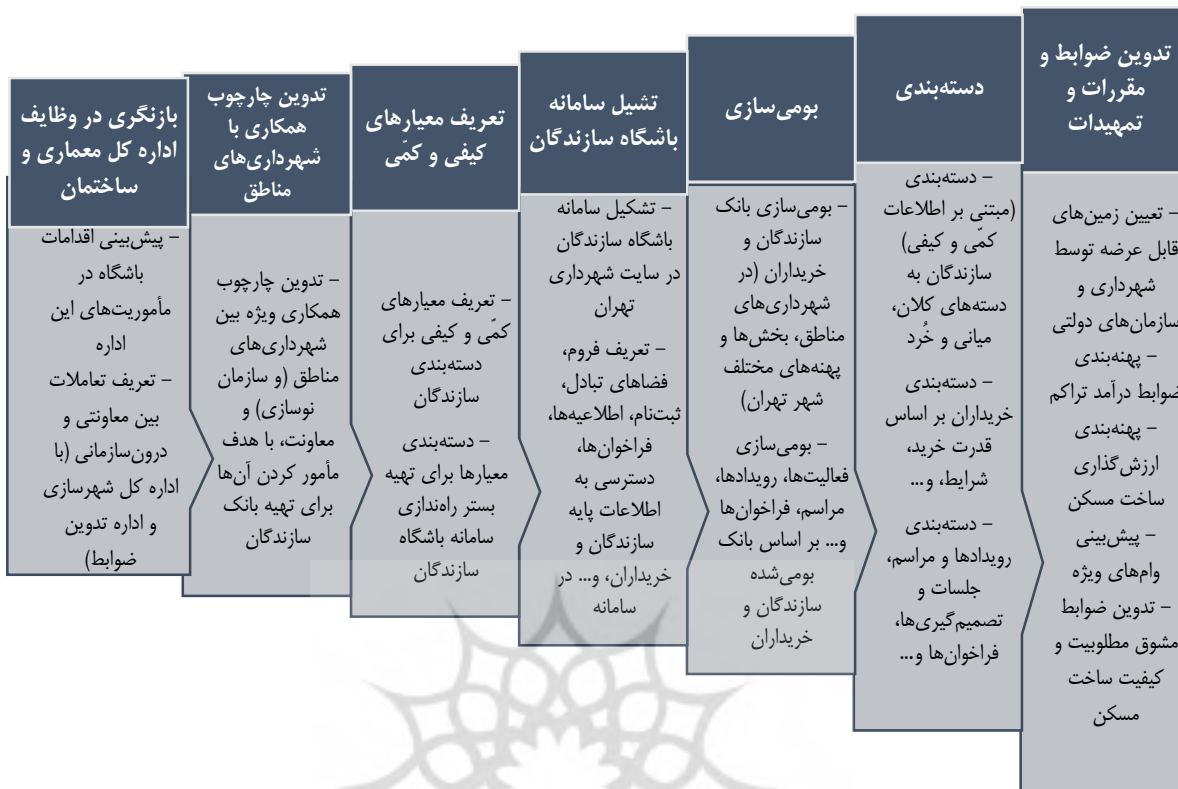
شکل ۴. فرایند پیشنهادی تشکیل باشگاه سازندگان

برخی بانک‌های اطلاعاتی معدود در شهرداری‌های مناطق در این خصوص وجود دارد، اما از دسته‌بندی و تعیین معیار لازم برخوردار نیست. از سوی دیگر، شناسنامه صرف برخی سازندگان، حاوی ویژگی‌های اتصال‌دهنده و وحدت‌بخش و قابلیت‌های سیاست‌گذاری در آن اندک است. از این رو، تشکیل باشگاه سازندگان مسکن، یک رویکرد جامع برای دستیابی به راه‌حل‌های سریع و در عین حال علمی رونق ساخت مسکن در شهر تهران را فراهم می‌سازد. به این منظور، باید در اقدامی اجباری، مشخصات دقیقی از سازندگان مسکن تهیه شود، نسبت به دسته‌بندی آن‌ها بر اساس صفات واقعی و توانایی‌های رشد مبادرت به عمل آید. این باشگاه، در عمل با سه هدف اساسی شکل گرفته و قابل گسترش خواهد بود: (۱) ایجاد پایگاه و بستر سازندگان قانونی شهر تهران، و دسته‌بندی کیفی و کمی آن‌ها، (۲) ایجاد محیط رقابتی برای ارتقای کارکرد سازندگان، (۳) قابلیت ارجاع سریع ساخت مسکن هدفمند با هدف رونق تولید مسکن. سازوکار این امر، معاونت معماری و شهرسازی، خود در تشکیل بانک اطلاعات سازندگان مسکن می‌تواند اقدام‌کننده باشد. دسته‌بندی سازندگان به سطوح مختلف (به طور مثال، خرد، میانی و یا کلان)، با همکاری شهرداری‌های مناطق، ایجاد فراخوان قانونی و یا ثبت‌نام آن‌لین، به عنوان یک پیش‌شرط برای ارائه امتیازهای خاص و واگذاری‌های ساخت