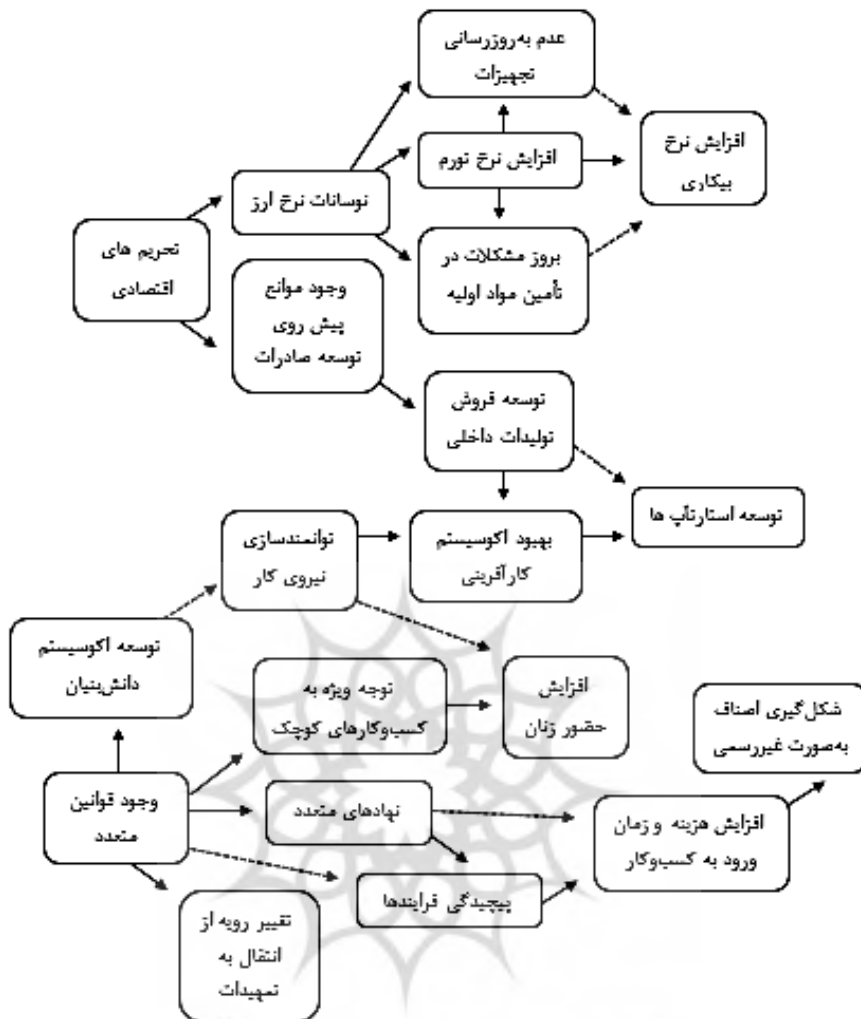
شکل ۳. نمودار حلقه علی روندهای اصلی

- وجود قوانین متعدد و موازی کاری - وجود نهادهای ذی نفوذ متعدد