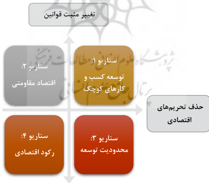
شکل ۶. نمودار ماتریس سناریوسازی

با توجه به اینکه استفاده از شیوه‌های استارت‌آپی در داخل کشور با هزینه کمتر و سهولت بیشتری همراه است، توسعه این شیوه نیز سرعت بیشتری می‌یابد. که خود زمینه مناسبی را برای اشتغال‌زایی فراهم خواهد کرد.