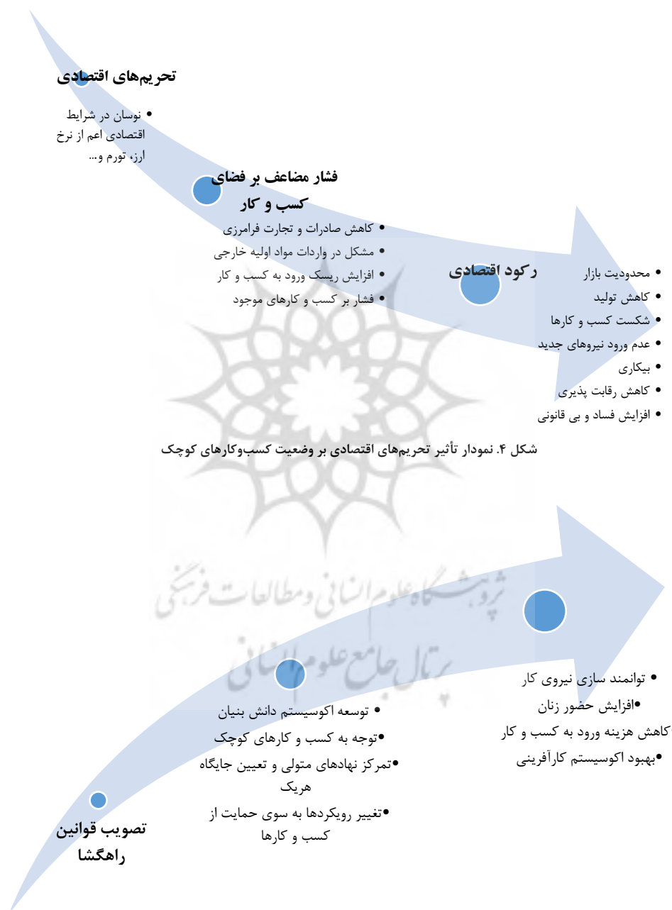
شکل ۴. نمودار تأثیر تحریم‌های اقتصادی بر وضعیت کسب و کارهای کوچک

با توجه به نمودار یادشده، روندهای اصلی که می‌توانند به‌عنوان عدم قطعیت‌های اصلی مد نظر قرار گیرند، عبارت‌اند از: • تحریم‌های اقتصادی • وجود قوانین متعدد مرحله ۳: تجسم در این مرحله، با توجه به عدم قطعیت‌های شناسایی‌شده، می‌توان دیاگرام سناریو را رسم کرد. این چهار سناریو، چهار وضعیت را مبتنی بر وقوع یا عدم وقوع دو حالت اصلی نشان می‌دهند.