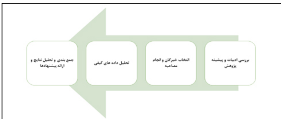
شکل (۲): مراحل انجام پژوهش.