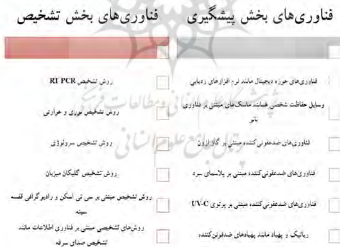
شکل (۱): دسته‌بندی فناوری‌های مرتبط با دو بخش پیشگیری و تشخیص کووید-۱۹.

ارتباطات مانند بیگ دیتا و هوش مصنوعی است که امکان استفاده از منابع تحقیقاتی موجود در سیستم عامل‌های آنلاین جهانی نظیر سازمان بهداشت جهانی و سایر سازمان‌های بین‌المللی را فراهم می‌کند. علاوه بر این، هوش مصنوعی می‌تواند به سرعت اطلاعات با مقیاس بزرگ مبتنی بر منابع محاسباتی با عملکرد بالا را یاد بگیرد، تشخیص دهد و تجزیه و تحلیل کند و در نهایت تصمیم‌گیری را امکان پذیر می‌کند. همچنین انتظار می‌رود با استفاده از هوش مصنوعی، زمان لازم برای تولید دارو کاهش یابد زیرا هوش مصنوعی توانایی یادگیری بر اساس داده‌های پزشکی و داده‌های دریافتی مرتبط با ویروس موردنظر را دارد. یک شرکت کره‌ای با استفاده از هوش مصنوعی، یادگیری عمیق ۴۵ و پلتفرم‌های مرتبط توانست تداخلات دارویی را پیش‌بینی کند و داروی جدید ویروس کرونا را پیشنهاد دهد. یک شرکت دیگر و محققان آن برای شناسایی داروهای تجاری موجود که می‌توانند بر ویروس کرونا موثر باشند، از مدل تعاملی دارو-هدف مبتنی بر یادگیری عمیق به نام Molecule Transformer-Drug Target Interaction (MT-DTI) استفاده کردند. همچنین یک استارت‌آپ تحقیقات دارویی ۴۶ مبتنی بر هوش مصنوعی نیز با استفاده از بیوانفورماتیک ۴۷ و فارماکوژنومیک ۴۸ برای بیماری‌های صعب‌العلاج و نادر، در حال توسعه عامل‌هایی برای یافتن مواد دارویی پیشنهادی برای درمان موثرتر کووید-۱۹ است. در شکل (۱) فناوری‌های مرتبط در هر دو دسته قابل مشاهده‌اند.