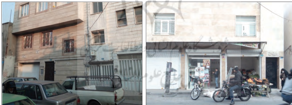
شکل ۴. (راست) ساختمانی قدیمی‌ساز با سه واحد تجاری کوچک در طبقه همکف / (چپ) یک آپارتمان ساختمان

همچنین در حالیکه بافت قدیمی حاوی واحدهای تجاری بسیار کوچک (و در نتیجه ارزان)، گاهی با مساحتی در حد سه تا چهار مترمربع و کسب و کارهایی رو به زوال (همچون رفوگری، لحاف‌دوزی، تعمیر دوچرخه، تعمیرات لوازم منزل، ...) در همکف بودند که به نظر پاسخگوی برخی نیازهای محلی است، بر اساس ضوابط ساختمانی، طبقه همکف معمولاً به پارکینگ خودرو اختصاص داده می‌شود (شکل ۴). این در حالی است که مشاهدات ما حاکی از استفاده گسترده مردم محلی از موتور سیکلت در محل است، که تناسب بیشتری هم با خیابان‌های باریک، ولی به هم پیوسته شوش دارد - پیمایش نمونه‌ای شهرداری هم گوشزد می‌کند که با آن که حدود ۷۰ درصد خانه‌های محله پارکینگ ندارند، تنها ۲۷ درصد از پاسخ‌دهندگان کمبود جای پارک را بحرانی دانسته‌اند (کاوینفر، ۱۳۹۴).