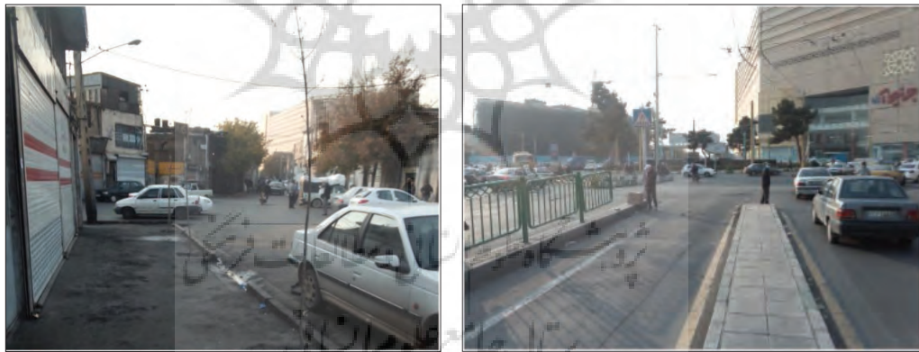
شکل ۲. (راست) مراکز خرید تازه تأسیس لوازم منزل در غرب میدان / (چپ) بازار قدیمی اوراقچی‌ها در شرق میدان شوش

برخی فعالان مدنی به وجود منافعی در تنزل و پایین ماندن ارزش املاک مسکونی اشاره می‌کنند. مثلاً واحدهای صنعتی و تجاری، مهاجران و پناهندگان کم‌درآمد ساکن در محله -وحتی کودکان- را در برابر دستمزدهای پایین به کار می‌گیرند (مدیر محلی جمعیت امام علی، سخنرانی در ۲۸ مهر ۱۳۹۸). از سوی دیگر تعارض منافع میان بازار اوراقچی‌ها و بازار رو به رشد لوازم منزل در اطراف میدان شوش در این میان به نظر بی‌تأثیر نیست (شکل ۲). اسناد رسمی، فعالیت اوراقچی‌ها را آلاینده و مزاحم تشخیص داده و مقرر کرده است که آنها به حومهٔ تهران نقل مکان نمایند. هم‌زمان تصاویر دهشتناک خبرگزاری‌ها از این بازار این صفت را بیشتر توجیه می‌کند و حتی می‌تواند به تنزل بیشتر قیمت هم دامن بزند. امری که به گفتهٔ مدیر دفتر توسعهٔ محله‌ای، مقاومت (گاهی خشونت‌بار) بازماندگان این بازار را به همراه داشته است (سخنرانی در پاییز ۱۳۹۸). این وضعیت بنا بر صحبت‌های مدیر محلی جمعیت امام علی (سخنرانی در ۲۸ مهر ۱۳۹۸) در مقطعی از زمان با ارائهٔ خدمات حساب‌نشدهٔ برخی نهادهای ظاهراً مردمی به معتادان و تجمع آنها در اطراف میدان تشدید شد. گویا بخش عمده‌ای از زمین‌های تجاری مرغوب اطراف میدان شوش که بعدها تبدیل به مراکز خرید فعلی شدند، در همان دورهٔ افت شدید قیمت‌ها (میان ۹۴ و ۹۶) تملک شدند ۱۲ .