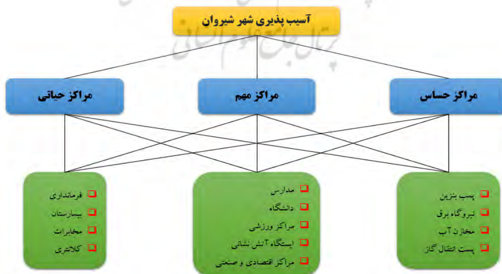
شکل شماره ۱. مدل تصمیم‌گیری ANP به منظور بررسی آسیب‌پذیری شهر شیروان