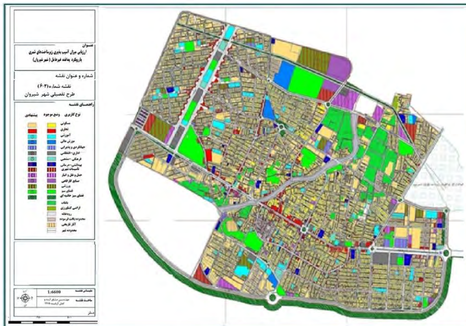
شکل شماره ۲. نقشه کاربری اراضی شهر شیروان