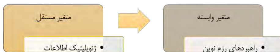
شکل شماره ۱. مدل مفهومی تحقیق

تحول سیستم بین‌الملل از روش خطی به پیچیده- آشوبی جنگ و دستگاه تحلیلی آن را با گزاره‌های نظری جدیدی روبرو ساخته و گسترش پدیده جنگ و اشکال نوین و ناشناخته آن، ضرورت پژوهش حاضر را نمایان‌تر می‌سازد. در کل پژوهش حاضر دارای دو هدف نظری و کاربردی است. هدف نظری دانش افزایشی و کمک به حوزه نظریه پردازی راهبردی مبتنی بر قدرت اطلاعاتی نسبت به روش جنگ‌های نوین با ارائه گزاره‌های علمی نوین براساس استنتاجی از نظریه‌های پیچیدگی و آشوب و سایر نظریه‌های مرتبط است و مهمترین هدف کاربردی آن نیز کمک به تدوین مدل تحلیلی- نظری کاربردی در خصوص مقابله با تهدیدات جنگ‌های هیبریدی قرار گرفته است. به صورت خلاصه می‌توان گفت ژئوپلیتیک اطلاعات به عنوان متغیر مستقل دارای رابطه علی با متغیر وابسته راهبردهای رزم نوین می‌باشد.