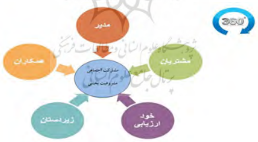
شکل ۱: منابع ارزیابی ۳۶۰ درجه (منبع: مک کارتی و گاراون، ۲۰۰۱)

بحث استقبال از "سیاست‌های جدید" بر اساس رسانه‌های جدی بسیار متنوع است. نگاه‌های گوناگونی در این ماجرا درگیرند. دالبرگ ۱۲ (۲۰۰۱)، سه الگو یا طرح پایه‌ای را توصیف می‌کند. اول الگوی طرفداری از "آزادی عقیده مجازی" که رویکردی به سیاست مبتنی بر مدل بازار مصرفی دارد. نظرسنجی‌ها، همه‌پرسی‌ها و رأی‌گیری از راه دور همه در این منظر قرار می‌گیرند و جایگزین فرایندهای قدیمی می‌شوند. دوم، نگاهی ارتباطی است که انتظار دارد سودها از مشارکت و مایه گذاشتن بیشتر قشرهای پایین دست و تقویت اجتماعات سیاسی محلی به دست آیند. سوم، در دمکراسی مبتنی بر مشاوره که از راه تکنولوژی پیشرفته‌تر ارتباطی و تبادل ایده‌ها در حوزه اجتماع به وجود می‌آید منفعت قطعی وجود دارد. در هر حال آثار منفی نیز در این میان وجود داشته است. چراکه احاطه شدن مجراهای ارتباطی توسط چند نفوذ خاص و محوریت "جریان عمودی" پیام، تجارت زدگی بازار رسانه‌ای، منجر به نادیده انگاشتن نقش‌های ارتباطی دموکراتیک می‌گشت. سازمان‌های نوعی و قالب‌های کلیشه‌ای ارتباطات جمعی، دسترسی را محدود می‌کنند و گفتگو و مشارکت فعالانه را با دلسردی مواجه می‌سازند (همسوند و تینی، ۱۳۹۲). بنابراین، با توجه به مبانی نظری تحقیق حاضر، نمودار ذیل شکل می‌گیرد: