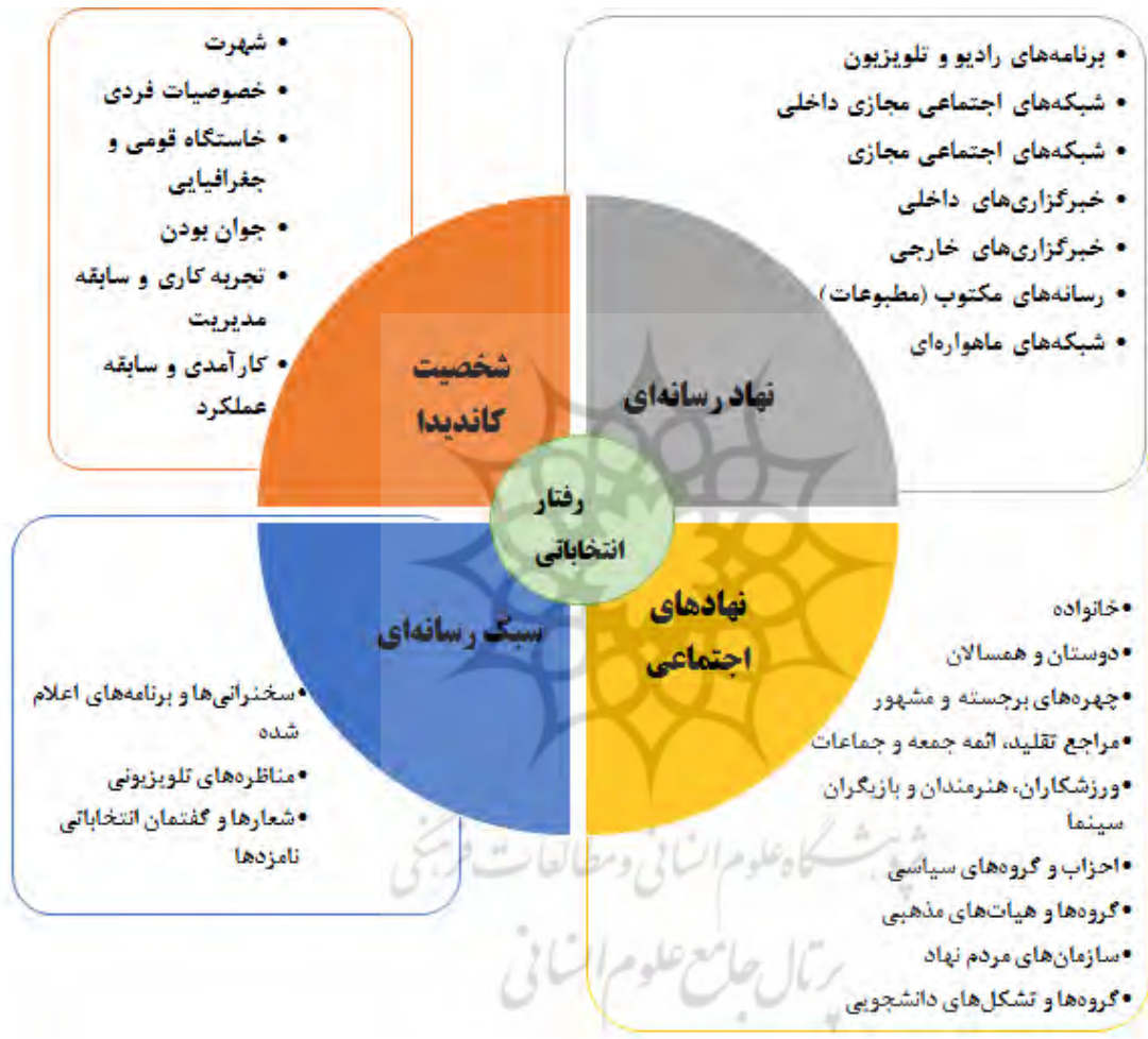
شاخص‌ها و مؤلفه‌های مؤثر بر رفتار انتخاباتی