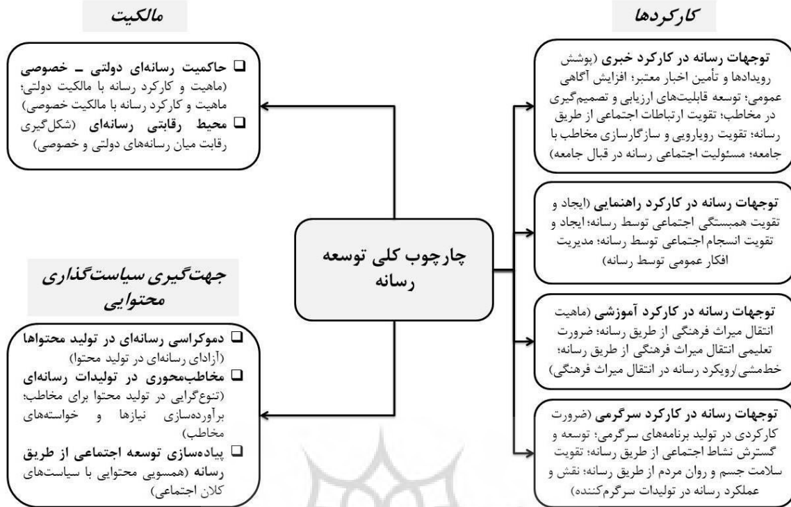
شکل (۳): چارچوب کلی توسعه رسانه (کانادا - نروژ)