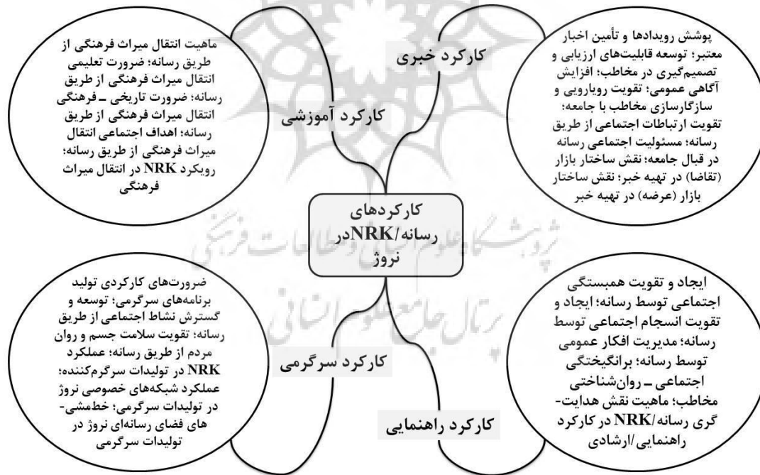
شکل (۲): الگوی کارکردهای رسانه‌های شبکه NRK