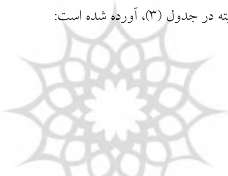
جدول (۳). نتایج آزمون نرمالیته

نتایج آزمون‌های نرمالیته در جدول (۳)، آورده شده است: