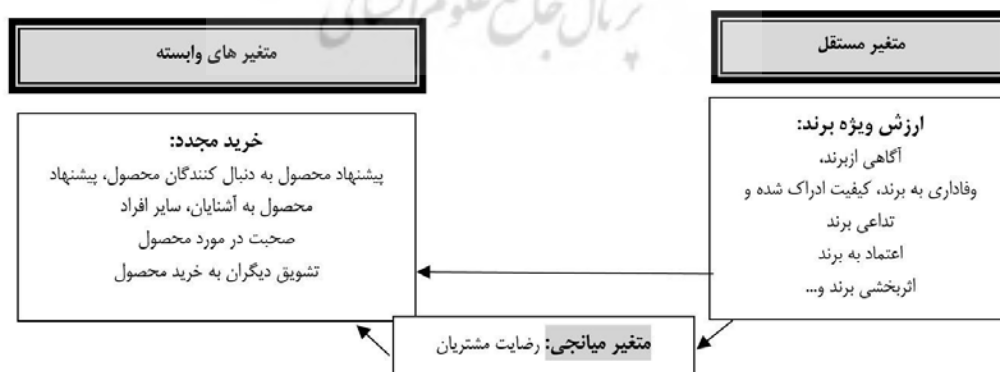
شکل ۱: مدل مفهومی تحقیق (منبع: جانگ و همکاران، ۲۰۲۱؛ لینتا و همکاران، ۲۰۱۹)