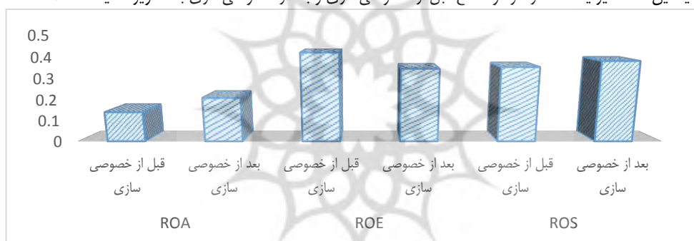
نمودار ۱- متوسط متغیرهای سودآوری قبل و بعد از خصوصی‌سازی

با توجه به نگاره ۱، میانگین نرخ بازده دارایی‌های شرکت‌های نمونه قبل از خصوصی‌سازی برابر با ۱۴ درصد و بعد از خصوصی‌سازی برابر با ۲۰/۷ درصد می‌باشد. بررسی انحراف معیار این متغیر نشان می‌دهد نرخ بازده دارایی‌های شرکت‌های نمونه هم قبل از خصوصی‌سازی و هم بعد از خصوصی‌سازی از پراکندگی نسبتاً کمی برخوردار می‌باشد بطوری که قبل از خصوصی‌سازی کمترین و بیشترین مقدار آن به ترتیب ۸- درصد و ۴۱/۲ درصد بوده و بعد از خصوصی‌سازی کمترین و بیشترین مقدار آن به ترتیب ۱/۷ درصد و ۴۰/۶ درصد می‌باشد. بررسی چولگی و کشیدگی این متغیر در هر دو مقطع قبل از خصوصی‌سازی و بعد از خصوصی‌سازی حاکی از نزدیک بودن توزیع آن به توزیع نرمال است. همچنین میانگین نرخ بازده حقوق صاحبان سهام شرکت‌های نمونه قبل از خصوصی‌سازی برابر با ۴۱/۸ درصد و بعد از خصوصی‌سازی برابر با ۳۴/۴ درصد می‌باشد. بالا بودن مقدار انحراف معیار این متغیر از میانگین آن گویای پراکندگی نسبتاً زیاد آن هم قبل از خصوصی‌سازی و هم بعد از خصوصی‌سازی می‌باشد. بطوری که قبل از خصوصی‌سازی کمترین و بیشترین مقدار آن به ترتیب ۰/۱ درصد و ۱۰۰/۳ درصد بوده و بعد از خصوصی‌سازی کمترین و بیشترین مقدار آن به ترتیب ۰/۱۸ درصد و ۱۰۰/۳ درصد است. بررسی چولگی و کشیدگی این متغیر در هر دو مقطع قبل از خصوصی‌سازی و بعد از خصوصی‌سازی نشان دهنده نزدیک بودن توزیع آن به توزیع نرمال می‌باشد. در نمودار ۱-۴ میانگین سه متغیر یاد شده در هر دو مقطع قبل از خصوصی‌سازی و بعد از خصوصی‌سازی به تصویر کشیده شده است.