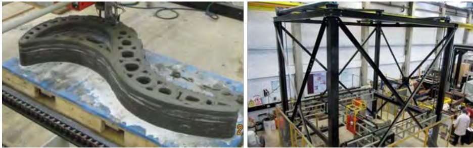
شکل ۳- سیستم چاپ بتن (در سمت چپ) و نیمکت چاپی (در سمت راست) (Lim, Buswell, Austin, Gibb, Thorpe, 2012)

تحقیق شرح داده شده در مقاله (Lim, Buswell, Austin, Gibb, Thorpe, 2012) از ماسه‌ای با حداکثر اندازه دانه ۲ میلی‌متر استفاده می‌کند. به عنوان اجزای اتصال از سیمان CEM I ۵,۵۲، خاکستر بادی و غبار سیلیس غیر فشرده استفاده شده است. برای اجزای خشک مخلوط آب به همراه فوق روان کننده مبتنی بر پلی کربوکسیلات برای افزایش کارایی و استحکام مواد اضافه و برای به دست آوردن زمان باز مناسب، کندکننده بر پایه آمینوتریس (متیلن فسفونیک اسید)، اسید سیتریک و فرمالدئید اضافه شده است. مطالعات نیز همچنین با استفاده از یک شتاب دهنده مبتنی بر سولفون‌ها، نمک‌های آلومینیوم و دی اتانول آمین انجام شده است. بتن همچنین حاوی میکروالیاف پلی پروپیلن به طول ۱۲ میلی‌متر و قطر ۱۸ میلی‌متر است که برای کاهش انقباض و تغییر شکل در حالت پلاستیک طراحی شده است. (Lim, Buswell, Austin, Gibb, Thorpe, 2012)