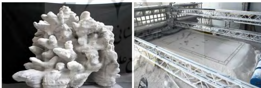
شکل ۲- چاپگر (D-Shape در سمت چپ) و شی چاپ شده - صخره مرجانی (در سمت راست) (D-Shape, 2018)

چاپگر D-Shape می‌تواند ساختارهای یکپارچه را چاپ کند (شکل ۲). این چاپگر با استفاده از پودر، فرآیند رسوب را با استفاده از یک چسب خشک می‌کند. (Lim, Buswell, Austin, Gibb, Thorpe, 2012) در این روش فرآیند چاپ شامل چیدمان با ضخامت مناسب مصالح ساختمانی، متراکم شدن لایه و استفاده از یک اهرم توسط نازل نصب شده بر روی سطح شیب دار می‌باشد. پس از اتمام فرآیند چاپ، شی چاپ شده از بستر پودر شل استخراج می‌شود. (Lim, Buswell, Austin, Gibb, Thorpe, 2012) در فرآیند چاپ میکرو بتن سیمانی از موادی با دانه بندی‌های مختلف استفاده می‌شود. از ۰.۲ تا ۵ میلی‌متر و اتصال مواد را می‌توان با محلول‌های آب یا سیمان انجام داد. (Lim, Buswell, Austin, Gibb, Thorpe, 2012) ماده خام بی اثر ممکن است: سنگ خرد شده، ماسه، شن، سنگدانه‌های رسی خرد شده و سرامیک باشد. همچنین می‌توان از مواد بازیافتی مانند: شیشه، خرده چوب خرد شده، پلاستیک، مواد تخریب، لاستیک، گچ یا مخلوطی از دسته‌های ذکر شده در بالا که تقویت شده استفاده کرد و توسط الیاف: طبیعی، شیشه، بازالت، پلیمر یا فولاد، به عنوان چسب مایع و از معرف‌های دسته‌های بی اثر: سوسپانسیون‌های مبتنی بر سیمان پرتلند، سیمان سورل یا ژئوپلیمرها، پرایمرهای پلیمری (اورتان، سیلوسان، وینیل با نمایش فنولیک PPC, PBB, اهرم) استفاده می‌شود. (D-Shape, 2018)