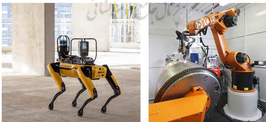
شکل ۱- نمونه ربات، ربات KUKA سمت راست و ربات نظارت کننده سمت چپ

ربات‌ها بر اساس چندین معیار مهم مانند منبع انرژی یا مکان دقیق مفصل‌ها و هندسه و ساختار سینماتیک دسته بندی می‌شوند. این طبقه بندی در درجه اول برای تعیین ربات مناسب برای یک کار خاص در نظر گرفته شده است. به عنوان مثال، ربات‌هایی که برای عملیات فرز و برش استفاده می‌شوند، برای مونتاژ مناسب نیستند (Spong, M. W., Hutchinson, S., & Vidyasagar, M., 2020)