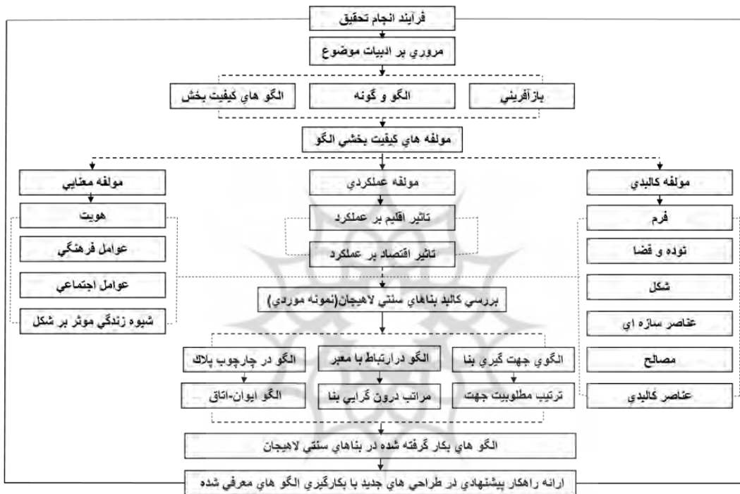
تصویر ۱: ساختار تحقیق

تحقیق حاضر از نظر هدف کاربردی است و از نظر ماهیت روش توصیفی است. از آنجایی که وجوه مدنظر این پژوهش از مفاهیم اصلی، قابل اندازه گیری نیستند، از روش توصیفی برای تعریف و روش تحلیلی برای ارزیابی آن ها کنار هم بهره گرفته شد، با توجه به تفکیک مولفه های کیفیت بخشی الگو در بخش بررسی نمونه موردی تنها مولفه کالبدی بررسی و در نهایت با استنتاج از این داده های کیفی در بخش کالبد، پیشنهاداتی منطبق بر استانداردها ارائه می شود. (تصویر ۱)