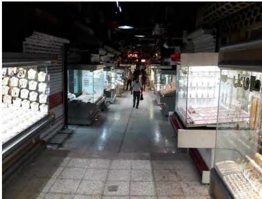
شکل ۵: نمایی از بازار زرگرها کرمانشاه