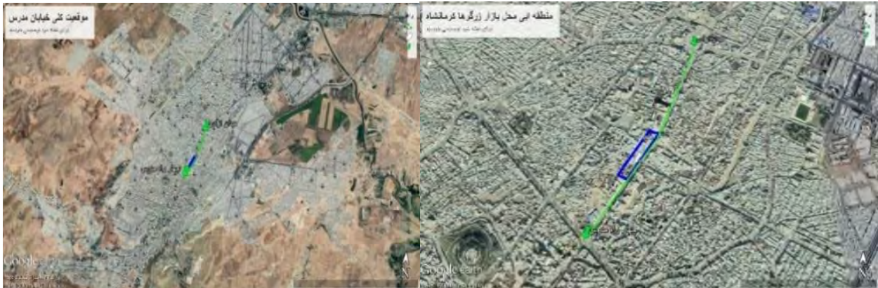
شکل ۲: موقعیت بازار زرگرها و خیابان مدرس کرمانشاه

از سوی شهرداری وقت کرمانشاه ارائه شد. عملیات اجرایی تعریض این خیابان از سال ۱۳۴۸ آغاز شد و تاکنون به اتمام نرسیده است. این تأخیر سبب شده تا بسیاری از بناهای این خیابان ارزش تاریخی پیدا کرده و تخریب آنها به منظور تعریض خیابان، نگرانی دوستداران میراث فرهنگی را در پی داشته باشد. (برومند سرخابی، هدایت الله، ۱۳۸۸: ۲۶۶)