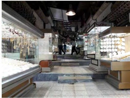
شکل ۴: نمایی از بازار زرگرها کرمانشاه