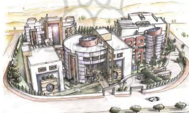
شکل ۲- نمایش کلی ساختمان مدرسه ADVANCE

اولین ساختمانی است که بر اساس تئوری طراحی حسی و معیارهای آن (AUTISM ASPECTSSTM) ساخته شده ، مرکز پیشرفت های قاهره مصر حاصل تحقیقات کامل مصطفی از معماری برای اتیسم در سال ۲۰۰۲ است (Latane and Kaihara Arce n.d.).