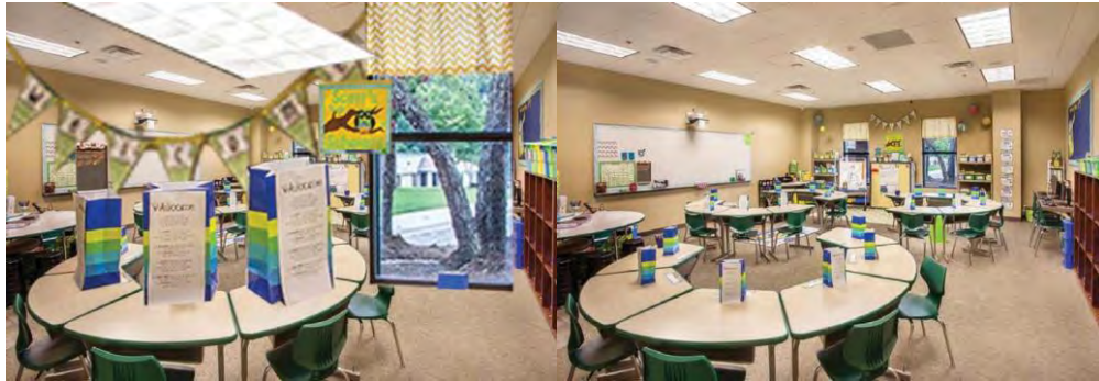
شکل ۵- تصاویر درک گشتالت (McLaren and Proksch 2016)

مفهوم درک گشتالت، به معنی عمل درک تمام جزئیات در یک تصویر حسی است. در این صورت واژه گشتالت سعی در اشاره به یک برداشت کل‌نگرو ادغام تمام جزئیات در یک کل است. (Sánchez, Vázquez and Serrano 2011) به گفته بوگداشینا ۱ ، افراد اتیسمی از طریق محرک‌های حسی ناشی از دریافت اطلاعات حسی در جزئیات نامحدود و همان زمان ادراک از کل صحنه‌که به عنوان یک موجودیت واحد با تمام جزئیات درک شده به طور همزمان توصیف می‌شود، بمباران می‌شوند. زمانی که اطلاعات زیادی نیاز است به طور همزمان در کودکان اتیسمی پردازش شود، آنها فقط آن بیت‌ها را پردازش می‌کنند که در توجه خود یعنی "درک پراکنده" مورد توجه قرار می‌گیرند. با توجه به بوگداشینا و اوبراین، افراد اتیسمی در پردازش فرم دیداری کسری دارند. (Gopal and Raghavan 2018) یک نظریه همبستگی مرکزی ضعیف نشان می‌دهد که افراد مبتلا به اختلالات طیف اتیسم توانایی ضعیفی در پردازش اطلاعات به صورت کل معنادار یا گشتالت دارند اما از توانایی زیادی در تمرکز بر جزئیات برخوردار هستند (STEWART, et al. 2009).