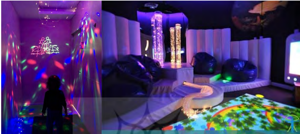
شکل ۱- اتاق تاریک https://anjomanmaaref.com

رویکرد طراحی حسی برای اتیسم توسط مصطفی ۲ (۲۰۰۸) ارائه شده این رویکرد به تعادل تجربیات حسی می پردازد، به عنوان مثال ایجاد یک محل اقامت خنثی حسی که در آن ویژگی های بصری، صوتی به صورت پویا و ملموس می تواند به راحتی متناسب با اولویت های خاص فرد تنظیم شوند و ساکنان بتوانند بهترین محیط حسی مناسب را برای خودشان انتخاب کنند (Nguyen, d'Auria and Heylighen 2020). ایجاد اتاق های چندحسی، نوعی درمان است که در حال حاضر در سراسر دنیا استفاده می شود. این اتاق ها برای ایجاد محیط های امن و آرامش بخش طراحی شده اند که افراد میتوانند فرصت تحریک، توسعه یا متعادل کردن سیستم های حسی خود را فراهم آورند (Wilson 2006). اتاق های حسی در بسیاری از اشکال مختلف ظاهر می شوند. ساده ترین آنها اتاق های مجزا هستند که مجهز به سیستم ها و وسایلی بوده که به فرد اجازه می دهد تا رنگ و یا حتی شدت نور را تغییر دهد، همچنین صدا و موسیقی را کنترل کند. آنها معمولاً مجهز به کف نرم، تشک، صندلی و توپ هستند که از ساختار مواد مختلف تشکیل شده اند. اتاق های بزرگ و پیچیده شامل موارد دیگر مانند استخرهای شنا و سیستم های آبی ۳ هستند (Bielak-Zasadzka and Bugno-Janik 2019).