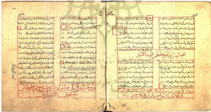
تصویر شماره (۱): دفتر اول، نسخه نافذ پاشا شماره ۶۷۰، مورخ ۶۸۰ ق.