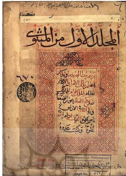
تصویر شماره (۲): ظهر دستنویس دفتر اول، نسخه نافذ پاشا ش. ۶۷۰، مورخ ۶۸۰ ق.