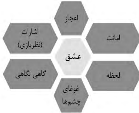
شکل ۱- معنای اول شعر «همزاد عاشقان جهان (۳)» به همراه نظام توصیفی

دیدگاه عشق‌ستیز تفکر سنتی شعر کهن و برخورد تقابلی با آن دومین معنای شعر «همزاد عاشقان جهان (۳)» یعنی «عقل» را در مرکزیت عناصری منظومه‌وار قرار می‌دهد. شکل شماره ۲ این معنای شعر را نشان می‌دهد.