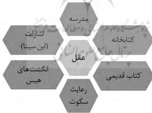
شکل ۲- معنای دوم شعر «همزاد عاشقان جهان (۳)» به همراه نظام توصیفی

دیدگاه عشق‌ستیز تفکر سنتی شعر کهن و برخورد تقابلی با آن دومین معنای شعر «همزاد عاشقان جهان (۳)» یعنی «عقل» را در مرکزیت عناصری منظومه‌وار قرار می‌دهد. شکل شماره ۲ این معنای شعر را نشان می‌دهد.