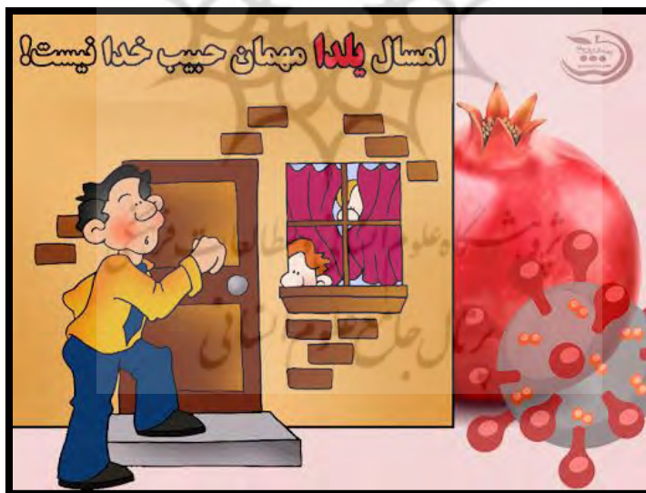
تصویر ۱. یلدای کرونایی