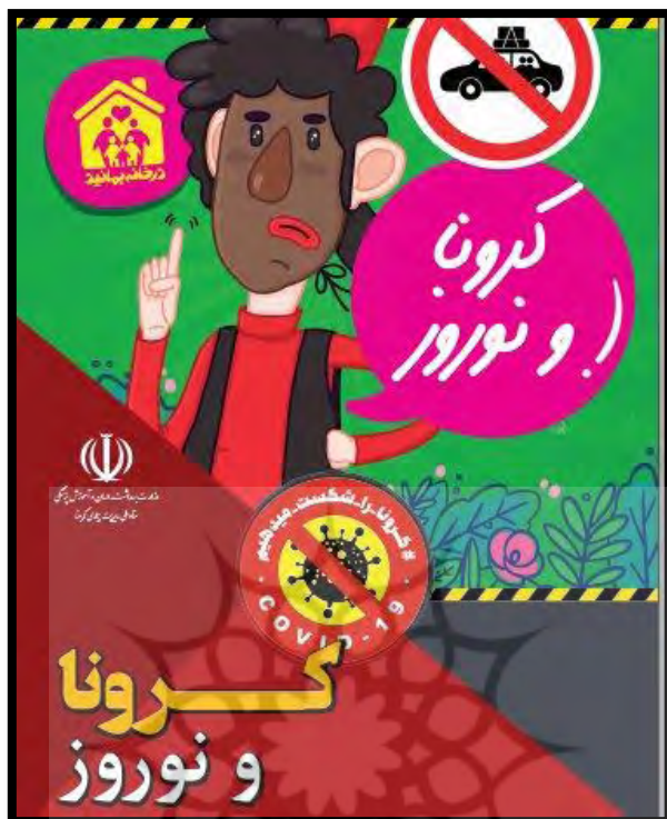
تصویر ۲. نوروز کرونایی