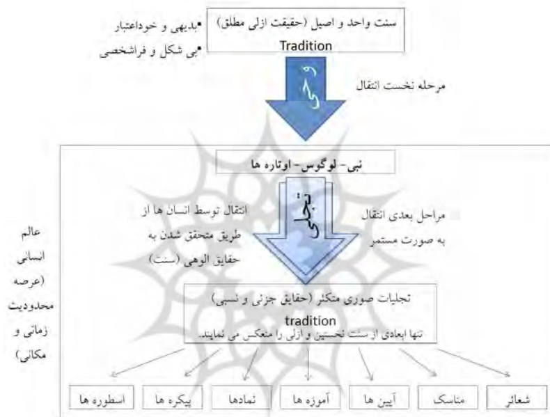
نمودار شماره ۱: تلقی سنت‌گرایان از مفهوم سنت (براساس الدمدو، ۱۳۸۹)

است: اول، سنت به معنی حکمت نخستین و ازلی یا حقیقت تغییرناپذیر و بی‌صورت؛ دوم، سنت به معنی تجسم صوری حقیقت در هیئت اسطوره‌ای یا دینی خاصی که در خلال زمان منتقل شده است؛ سوم، وسیله و محمل انتقال این تجسم صوری؛ چهارم، خود جریان انتقال (الدمدو، ۱۳۸۹: ۱۵۳). او خاطر نشان می‌سازد که حقیقت ازلی را تنها می‌توان با سنت در معنای نخستین یکی دانست؛ چراکه سنت متکثر یعنی تجسم‌های صوری آن حقیقت واحد تنها ابعادی از آن را منعکس می‌کنند (نمودار ۱).