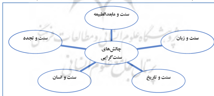
نمودار شماره ۲: زمینه‌های اصلی بروز چالش در اندیشه‌های سنت‌گرا

به‌طور کلی چالش‌هایی که سنت‌گرایی در عرصه کاربرد با آن‌ها مواجه است را می‌توان در پنج زمینه و مفهوم اصلی دسته‌بندی نمود که در ادامه به آن‌ها می‌پردازیم (نمودار ۲).