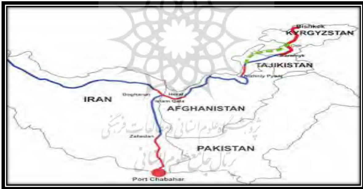
شکل ۴ مسیر ریلی کریدور کتای

در طرف مقابل، چین با اتصال بندر چابهار ایران به مسیر ریلی و جاده‌ای کریدور پاکستان-چین و جایگزینی آن با بندر گوادر پاکستان خواهد توانست تا حدود زیادی از میزان ریسک سرمایه‌گذاری خود در پاکستان به‌عنوان متحد ایالات متحده بکاهد. درواقع، بندر چابهار ایران این امتیاز را دارد که به‌طور همزمان به دو کریدور کتای (ایران، افغانستان،