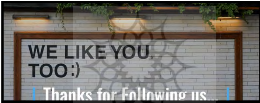
تصویر شماره ۳: کاور اصلی صفحه سفارت آمریکا در بغداد

اشاره به کودکان و آینده عراق و تأثیرات مثبتی که آمریکا می‌تواند داشته باشد، همسطح نشان دادن روابط عراق و آمریکا، تأکید بر نمادهایی با مضمون کمک‌های علمی و تکنولوژیک آمریکا به عراق، مقولاتی هستند که با توجه به تحت تأثیر قرار دادن ذهنیت مخاطب در خصوص قدرتی مثل آمریکا و نیز ایجاد رضایتی که در جامعه افراد تحت سلطه رقم می‌زند، در واقع هژمونی آمریکایی را بازتولید کرده و به استعمار عراق توسط این کشور کمک می‌کند.