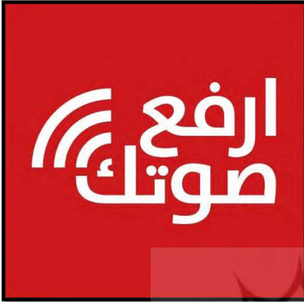
تصویر شماره ۶: پروفایل صفحه ارفع صوتک

تصویر پروفایل این صفحه دربردارنده نشان این کمپین است که شامل نام آن یعنی «ارفع صوتک» و خطوطی است که نماد رسانه‌ای و خبری بودن این تشکیلات است.