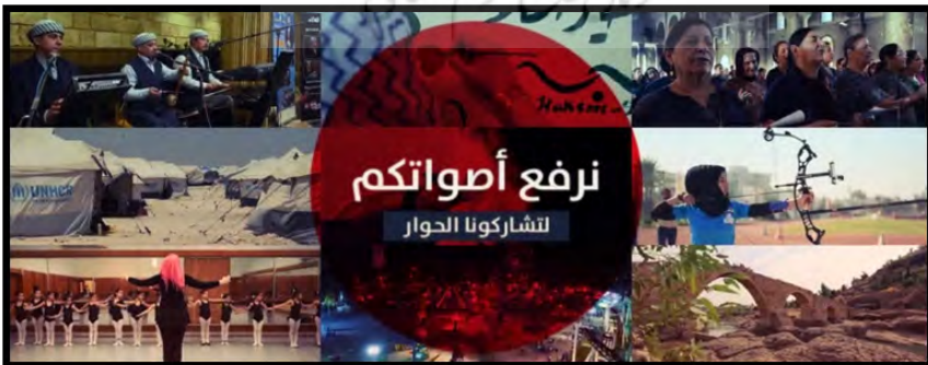
تصویر شماره ۷: کاور اصلی صفحه ارفع صوتک

شده است. در میان یکی از این تصاویر نوشته شده است: «صدایتان را بالا می‌بریم، برای گفتگو با ما در میان بگذارید.» در این تصویر عکس‌هایی وجود دارد که عبارتند از: نواختن موسیقی محلی توسط کردها، خطاطی توسط یک زن، مراسم دعای مسیحیان در کلیسا، اردوگاه کمیساریای عالی سازمان ملل متحد برای پناهجویان، ورزش تیراندازی با کمان توسط یک زن، ورزش ابروییک توسط کودکان دختر با یک مربی زن، شهر بازی و یک پل تاریخی. مضامین این عکس‌ها اشاره به پارامترهایی از جامعه عراقی دارد که مورد توجه و تمرکز این صفحه آمریکایی قرار گرفته است.