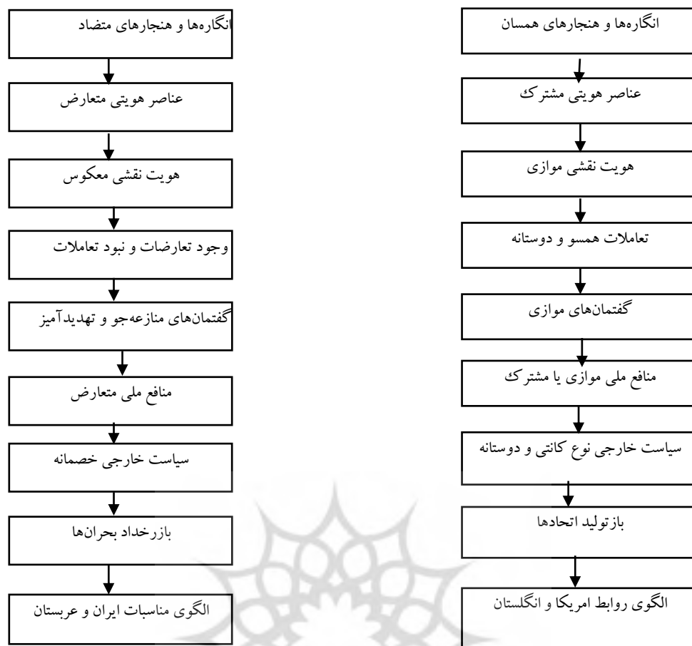
شکل (۳): الگوی خصمانه بر پایه فرهنگ‌هازی