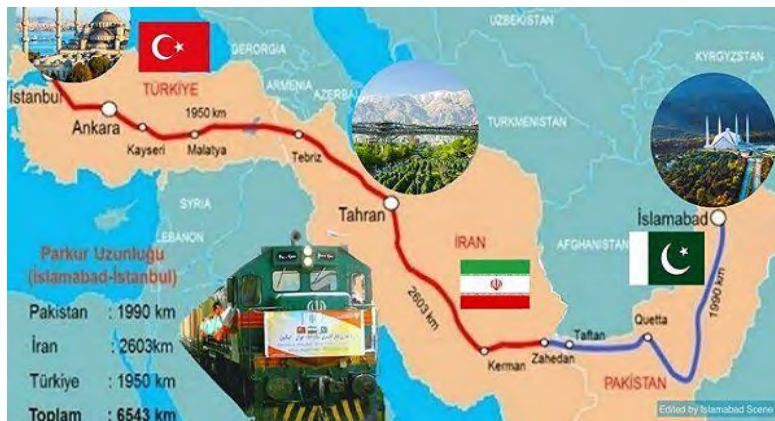
تصویر شماره ۲- مسیر ریلی ۶۰۰۰ کیلومتری پاکستان-ایران-ترکیه

در حال حاضر چند مسیر پروازی شامل تهران-اسلام‌آباد، تهران-کراچی (ایران ایر)، تهران-لاهور (ماهان)، مشهد-لاهور (تابان و ماهان) برقرار است که با توجه به حجم ورود و خروج سهم بسیار کمی در مسافرت‌ها داشته و لزوم گسترش آن احساس می‌شود (Hosseini, 2020). راه‌اندازی راه‌آهن تفتان-کوئته می‌تواند زمان رفت‌وآمد میان دو کشور را به میزان چشمگیری کاهش داده و مبادلات انسانی را افزایش دهد. در کنار محورهای فوق، تقویت کریدور ریلی پاکستان-ایران-ترکیه که می‌تواند بخش بزرگی از حمل‌تجارت مشترک میان سه کشور را شامل شود، می‌بایست در اولویت همکاری‌های ترازیتی سه کشور قرار گیرد.