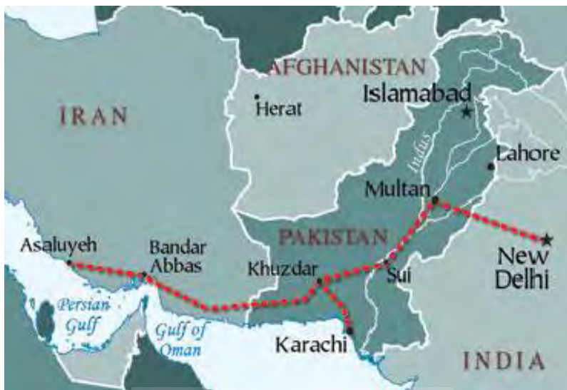
تصویر شماره ۱- مسیر خط لوله صلح (ایران-پاکستان-هند)