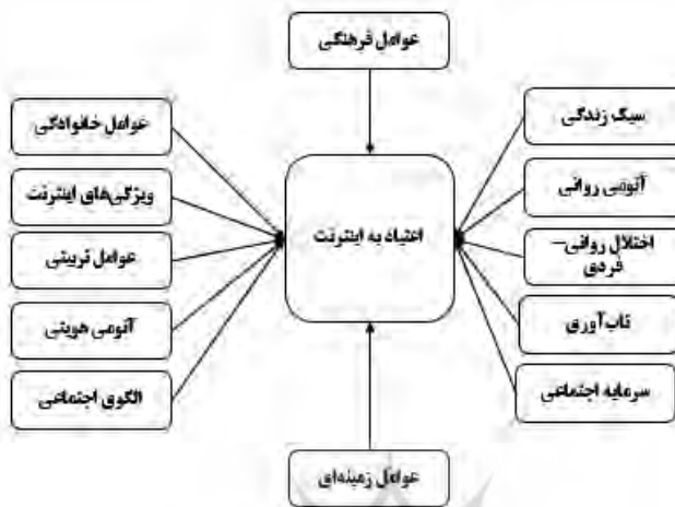
شکل ۱. ریشه‌های اعتیاد به اینترنت

نتایج نشان می‌دهد که، در مجموع، ۳۱ درصد از اعتیاد به اینترنت را عوامل مذکور تبیین کرده‌اند. در نهایت، عوامل مؤثر بر اعتیاد به اینترنت (نتایج ۵۰ پژوهش) در شکل ۱ آمده‌اند.