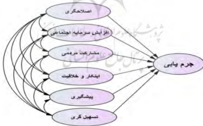
نمودار شماره (1) مدل مفهومی پژوهش

این پژوهش بر این فرض مبتنی است که تعامل اطلاعات محور پلیس و سمن‌ها، بر جرم‌یابی مؤثر است. جرم‌یابی در تعامل پلیس اطلاعات محور با سمن‌ها با شش بُعد اصلاح‌گری، افزایش سرمایه اجتماعی، مشارکت مردمی، افزایش ابتکار و خلاقیت، پیشگیری و تسهیل‌گری بیان می‌شود. همان‌گونه که در مدل مفهومی پژوهش نشان داده شده است، (نمودار شماره 1) سمن‌ها می‌توانند با شش بُعد ذکر شده، با پلیس در پیشگیری از جرم همکاری داشته باشند و در نهایت، با ایجاد تسهیلات لازم در عملیات پلیس بر جرم‌یابی تأثیر بگذارند.