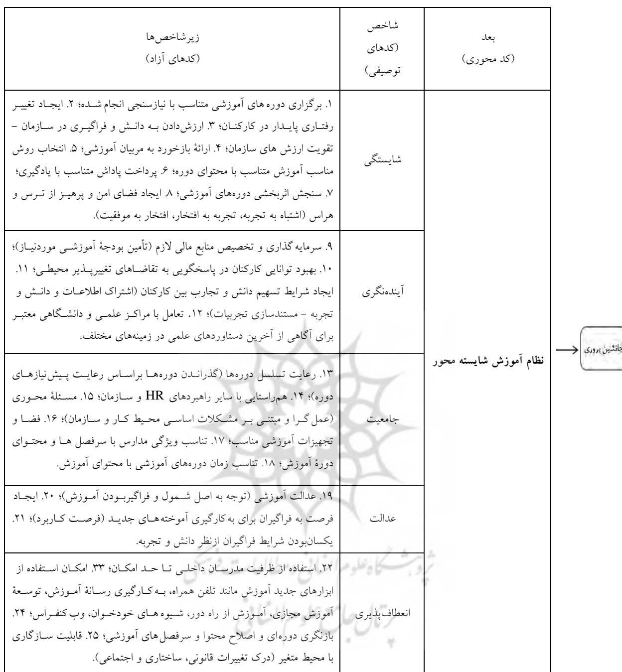
شکل ۲- الگوی کدگذاری و پارادایمی نظام آموزش شایسته محور براساس یافته‌های کیفی پژوهش