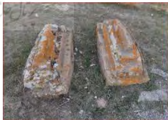
شکل ۲. نمونه‌ای از سنگ‌مزار پلکانی در روستای ورزقان (Authors, 2021)

۳- سنگ قبرهای پلکانی: سومین نوع از سنگ‌مزارها شکل پلکان داشته و از این منظر به آن سنگ‌مزارهای پلکانی گفته می‌شود. این نوع سنگ‌قبر از لحاظ جنس، نقش و خطوط شبیه به نوع صندوقی بوده و تنها از لحاظ شکل متفاوت است؛ سنگ‌مزارهای پلکانی دارای شکل یکسان نبوده و تعداد پلکان‌های آن‌ها متغییر است (Afqahi, 2009). نمونه‌ای از این سنگ‌قبر در روستای صومعه‌دل به تعداد دو عدد شناسایی شد (شکل ۲). این سنگ‌قبر دارای کتیبه بوده که به مرور زمان از بین رفته است.