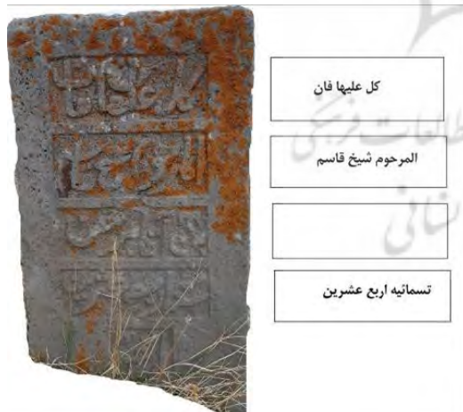
شکل ۳. نمونه ای از کتیبه‌های به‌کاررفته در سنگ قبرهای گورستان روستای گال ورزقان (Authors, 2018)

تاریخ این کتیبه‌ها بیش‌تر به شکل حروف عربی نوشته شده و در سنگ‌قبرهای معدودی تاریخ فوت، به‌صورت عدد ذکر شده است (شکل ۳). خطوط به‌کاررفته در کتیبه‌نگاری سنگ‌قبرها گورستان‌های مورد مطالعه، کوفی، ثلث و نستعلیق است. نوع خطوط و حجاری کتیبه‌ها حاکی از مهارت و توانایی هنرمند در جامعه محلی خویش بوده و ارتباط تنگاتنگی با پایگاه اجتماعی فرد متوفی نیز دارد. به‌طوری که خط نستعلیق در سنگ‌قبرهایی مورد استفاده قرار گرفته که اشکال قبور و تزیینات آن شاخص‌تر از گونه‌های دیگر است.