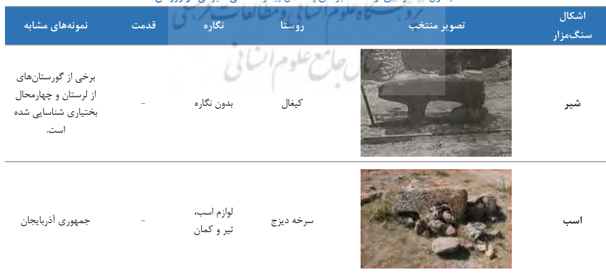
جدول ۳. نمونه‌ای از سنگ‌قبرهای به شکل پیکره سنگی حیوانی در ورزقان

مردم منطقه آذربایجان نسبت به پیکره‌های سنگی احترام زیادی قائل بوده‌اند؛ به طوری که زنان به منظور بارداری شدن به پای گوسفندان می‌افتادند و این سنگ‌مزارها از نسلی به نسل دیگر انتقال پیدا می‌کرد (Efandiof, 1986). واندنبرگ گاهنگاری سنگ‌مزارهای قوچی را به اشتباه مربوط به قبل از اسلام دانسته (Vandenberg, 1969) که براساس پژوهش‌های انجام شده این سنگ‌مزارها عمدتاً مربوط به سده ۱۰ هجری است (Kargar, 1993). پیکره قوچ در روستاهای ورجوی مراغه، گنبد کبود ورزقان، لیلاب، گال، اهر، مرند،