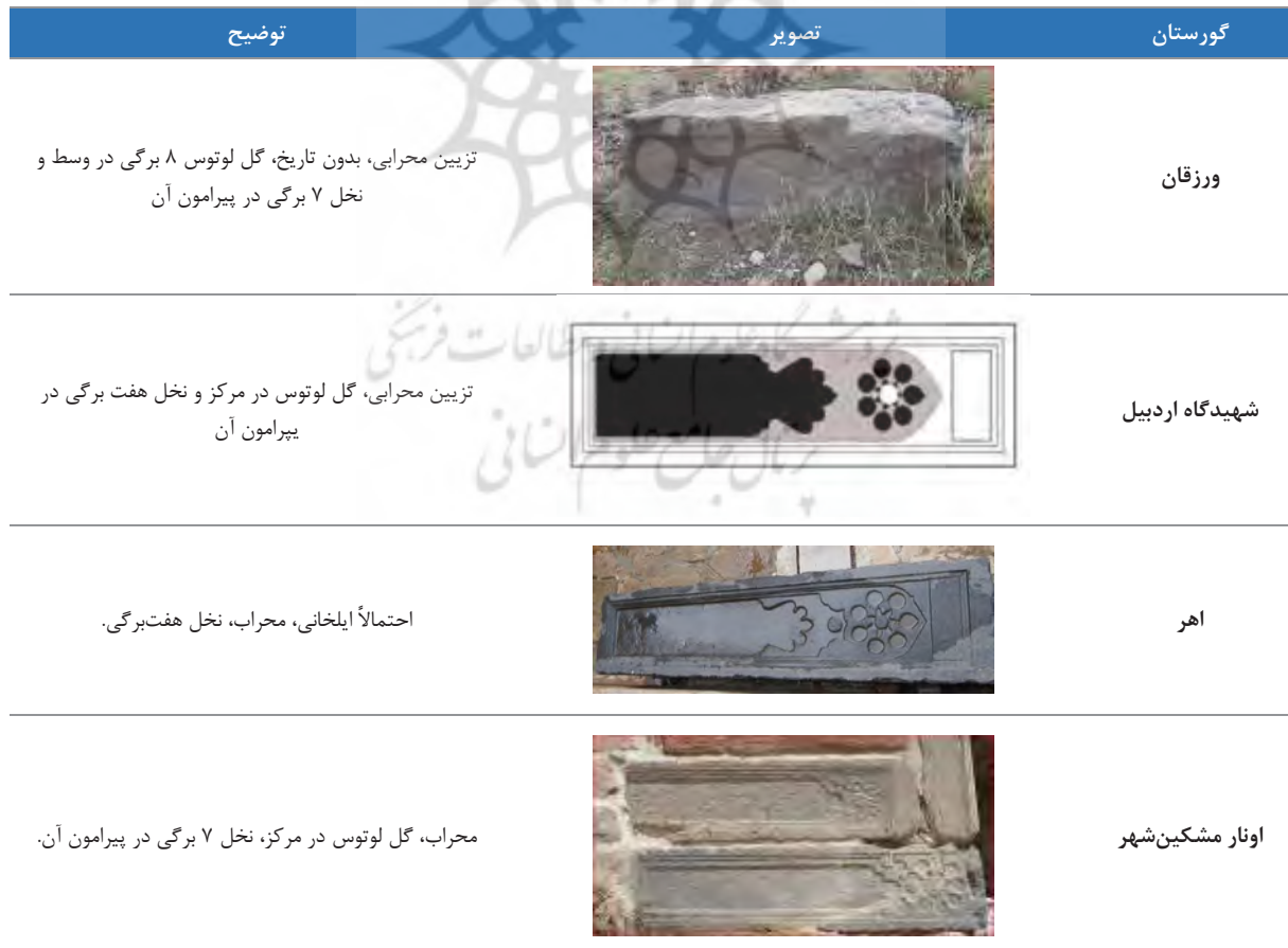
جدول ۱. تصویر. نمونه‌ای از سنگ‌قبرهای صندوقی آذربایجان ایران

۱- سنگ‌قبرهای صندوقی: سنگ‌مزارهایی به شکل مکعب‌مستطیل که دارای اندازه‌های متفاوت بوده و از تخته‌سنگ یکپارچه تراشیده شده‌اند. جنس سنگ این قبرها، عموماً مرمر، بازالتی، آهکی و ماسه‌ای است. این سنگ‌مزارها از لحاظ حجاری به دو نوع ساده و منقوش تقسیم می‌شوند. نمونه‌های از این سنگ‌مزارها در گورستان ورزقان، ینگجه، نصیرآباد، لیلاب، کرویق، سرخه‌دیزج، اندیرگان و اولیق شناسایی شد. این‌گونه سنگ‌قبرها، قابل‌مقایسه با نمونه‌های از سنگ‌قبرهای شیخ‌حیدر مشکین‌شهر، شیخ‌صافی اردبیل (Parvin et al., 2020)، اونار مشکین‌شهر (Samari & Rezalou, 2020)،