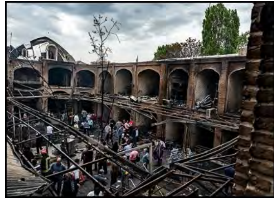
شکل ۳. تصاویری از وقوع آتش‌سوزی در سرای دو دری در سال ۱۳۹۸

ارزش مادی مغازه‌ها و علاقه به بزرگ نمودن مساحت بازار با تخریب جرز دیوارهاست. بررسی‌ها در خصوص تخریب عمدی بازاریان نشان می‌دهد که عمده تخریب صورت گرفته شامل تخریب پایه‌ها و ستون‌های بازار بوده که بیش‌تر در ورودی تیمچه‌ها و با هدف ایجاد مغازه‌های کوچک است. طبق آمار موجود در حدود ۱۴۸ مورد، تخریب و الحاق در مجموعه بازار تاریخی صورت گرفته است (جدول ۸).