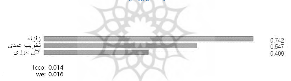
شکل ۴. نتایج خروجی سه مخاطره اساسی در بازار تاریخی تبریز به‌ترتیب میزان اولویت