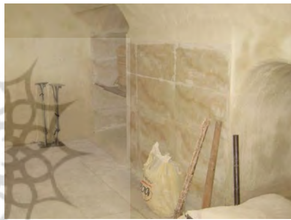
شکل ۱. نمونه‌هایی از نشست، ریختن سقف‌ها و طاق‌ها بر اساس فرسایش محیط (تصویر بالا سمت چپ) و همینطور، تخریب عمده سازه، از قبیل تخریب سقف‌های سازه‌ای و ایجاد بالابر (تصویر بالا سمت راست)، کاشی‌کاری، تراشیدگی دیوار و حذف طاق‌ها و ایجاد سقف‌های تخت (تصاویر پایین).