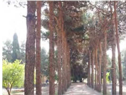
شکل ۱۰. محور شمالی - جنوبی باغ Author, 2019

۵. جهت‌گیری عمارت‌ها: عمارت شاه‌نشین رو به جنوب غربی قرار دارد و استفاده بهینه از توپوگرافی زمین در آن مشهود است و کوشک هشت‌ضلعی رو به شمال شرق جهت دارد و نمی‌توان ارتباط بصری مشخصی میان این دو بنای شاخص باغ مشاهده کرد. (شکل ۱۳)؛ البته کوشک‌های گشوده رو به طبیعت، جهت‌دادن به نگاه و گردش آن در باغ‌های شاه‌عباس اصل مهمی بوده است. گردش نگاه علاوه بر اینکه سبب مشاهده گوناگونی طبیعت در منظری وسیع می‌شد، موجب نظارت بر افراد و صاحب‌منصبان نیز بود. شاید این سخن تفسیری کارکردمدارانه از طرح باغ صفوی به نظر آید؛ با این حال نباید تصور کنیم که استفاده از باغ برای مقاصد سیاسی یا هرگونه کارکرد وسیع‌تر اجتماعی جنبه‌های اصلی آن را توضیح می‌دهد یا مشخص می‌کند؛ بنابراین باید از دگرگونی‌های تاریخی در استفاده فرهنگی یا سیاسی از باغ آگاه باشیم (Alami et.al, 2008).