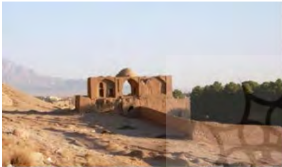
شکل ۱۲. عمارت شاه‌نشین و حصار باغ

۴. کوشک در باغ ایرانی یا درون حصار باغ قرار می‌گیرد، یا متصل به حصار باغ (باغ دولت‌آباد و نارنجستان قوام) و هیچ‌گاه حصار باغ را قطع نمی‌کند، اما در باغ بیرم‌آباد بخشی از عمارت شاه‌نشین خارج از حصار است و به عبارتی مرز باغ را شکسته و از جانب شمال در کوه فرو رفته است؛ بنابراین در این محدوده حصار باغ درحقیقت محدوده عمارت است و این شیوه استقرار کوشک در دیگر باغ‌ها وجود ندارد (Soltanzadeh & Ashraf Ganjooei, 2013) (شکل ۱۲).