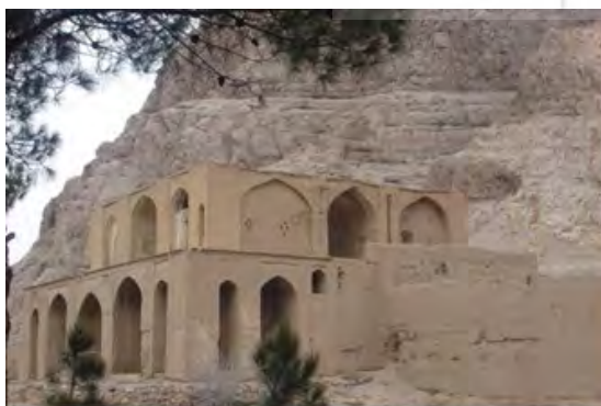
شکل ۱۵. نحوه ارتباط با طبیعت در کوشک مرکزی باغ بیرم‌آباد

۶. در باغ ایرانی برای ارتباط بیشتر با طبیعت، کوشک توسط عناصر طبیعی محاصره می‌شود. در عمارت هشت‌ضلعی وسط باغ بیرم‌آباد شاهد این مدعا هستیم، اما در عمارت شاه‌نشین شکلی متفاوت را می‌بینیم. عمارت از جانب شمال در کوه فرورفته و مرزی بین کوه و عمارت مشاهده نمی‌شود. از نظر حجمی نیز، مکعب زیرین بزرگ‌تر، مکعب کوچک‌تر روی آن و طاق نیم‌گنبدی به‌گونه‌ای است که می‌توان فرم ساده‌شده بنا را هماهنگ با کوه دید. به هر حال هدف، آمیزش با طبیعت بوده و شیوه رسیدن به آن، با توجه به بستر باغ به این ترتیب صورت وجودی یافته است