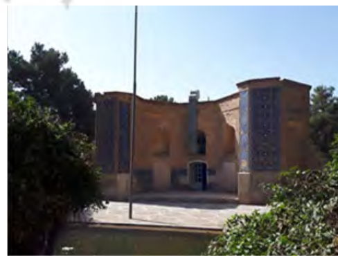
شکل ۱۴. نحوه ارتباط با طبیعت در عمارت شاه‌نشین