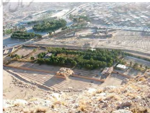
شکل ۳. نمایی از بالای کوه (سمت شرق) به سمت باغ

از آنجا که باغ‌ها سمبل تفکر دوران خویش بودند، ایجاد آنها علاوه بر مفید بودن و میل به ایجاد فضاهای زیبا با تکیه بر هنر باغبانی، دلیلی خاص نیز داشته است (Motedayen, 2011). با این نگاه باغ بیرم‌آباد در زمره باغ‌های حکومتی قرار می‌گیرد. باغ بیرم‌آباد به واسطه ماهیت و شکل خود می‌تواند نوعی «باغ قلعه» محسوب شود که در میان برج و باروهای خود محصور شده است. انتخاب این الگوی محصور در پناه دیوارهای بلند و برج‌ها، با کاربری حاکم‌نشین آن مرتبط بوده است. در دوران حکومت گنجعلی‌خان بر کرمان، وی باغ‌های دیگری را نیز ایجاد یا احیا کرده است، ولی تنها باغ به‌جامانده از آن دوران باغ بیرم‌آباد است. امین منشی کرمانی در ادامه مطلب توصیف باغ بیرم‌آباد آورده است: «در نزدیکی این باغ گنجعلی‌خان حاکم کرمان، باغی ساخته و نیز حوض آبی وسیع به‌صورت استخر ساخته که زمین آن سنگ است با عمق سه متر. این حوض را پر از آب می‌نمودند و بعضی از حکام هنگام فراغت از کارهای روزانه در کنار این حوض می‌نشستند و به تماشای آبزبانی که در این حوض گردش می‌کردند، می‌پرداختند» (Bastani Parizi, 1989). برای شناخت کلیت طرح باغ بیرم‌آباد، توجه به نحوه شکل‌گیری باغ، تغییرات آن و آشنایی با شیوه باغ‌سازی آن دوران لازم است. باغ بیرم‌آباد، مستطیل‌شکل با ابعاد ۱۸۵ در ۹۵ مترمربع است. ساختارهای مختلفی شکل باغ را تشکیل داده که عمده‌ترین آنها عبارت‌اند از: حصار باغ، عمارت شاه‌نشین، کوشک وسط، عمارت خلوت و محورهای باغ (شکل ۳).