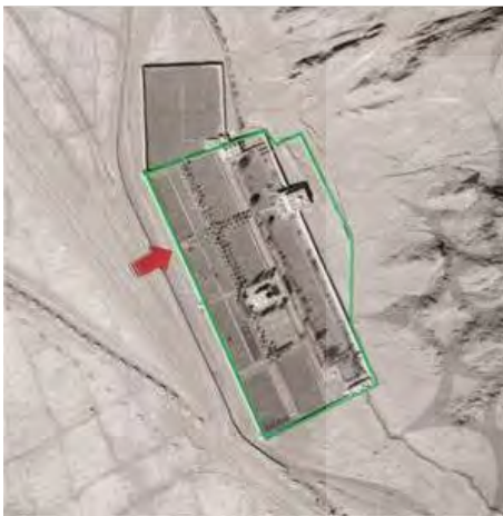
شکل ۴. وضعیت اولیه دیوارکشی و ورودی باغ بیرم‌آباد در دوره اولیه ساخت

چنان که شواهد و قراین نشان می‌دهد، باغ در دوره اولیه ساخت که زمان محمدخان استاجلو (دوران شاه‌اسماعیل صفوی) بوده، نقشه‌ای متفاوت با وضع موجود داشته است. حصار ضلع شرقی باغ تا دامنه نزدیک کوه امتداد یافته بود. ورودی باغ، همان ورودی فعلی در ضلع غربی باغ قرار داشت. تنها عمارت باغ، عمارت شاه‌نشین بوده که در یک‌سوم انتهایی محور اصلی باغ یعنی محور غربی-شرقی ساخته شده بود. چنان که عکس هوایی سال ۱۳۳۶ این موضوع را به خوبی نشان می‌دهد (شکل ۴).