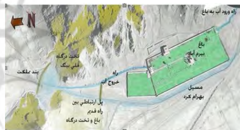
شکل ۹. مسیر ورود آب به باغ و خروج آن و مسیل ضلع غربی باغ

در این عکس علاوه بر این موارد، مسیر ورود آب به باغ نیز مشخص است. آب از سمت روستای سرآسیاب، از طرف جنوب (سمت عمارت خلوت) وارد باغ می‌شده و پس از آبیاری باغ از ضلع شمال باغ خارج می‌شده که در مسیر خود، راه مشجر دسترسی به باغ را به وجود آورده است (شکل ۹).