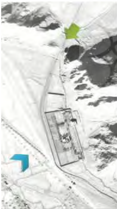
شکل ۱. محل استقرار باغ در امتداد مدخل تنگه راهبردی و وجود مسیل و قنات و نیز شیب جنوب غربی و شمال شرقی

باغ بیرم‌آباد در دامنه شیب ملایمی از امتداد شرقی کوه‌های صاحب‌الزمان آباد و در جنوبی‌ترین بخش آن ایجاد شده است. در ضلع غرب باغ، مسیل رودخانه‌ای فصلی و همچنین مسیر از بین رفته برخی رشته قنات‌ها قرار دارند. شیب تقریبی جنوب شرقی به شمال غرب، پیش‌زمینه‌ای برای احداث باغ بوده و باغ در امتداد مدخل تنگه‌ای راهبردی قرار گرفته است (شکل ۱). این باغ تنها باغ باقی‌مانده از گروه فراوان باغ‌ها در این منطقه است. باغ امتداد و راستایی تقریباً شمالی- جنوبی دارد که از سمت شرق به کوه تکیه داده است.