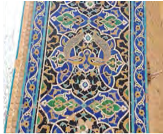
شکل‌های ۱۶ و ۱۷. تزیینات کاشی کاری نمای ورودی عمارت کوشک مرکزی