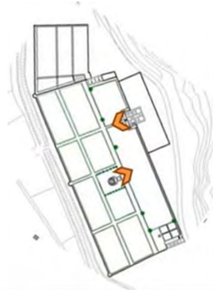
شکل ۱۳. جهت‌گیری عمارت‌های باغ بیرم‌آباد

۷. عمارت کوشک مرکزی در نمای شرقی خود که جبهه ورودی آن است، در سمت آب‌نما عقب‌نشینی دارد و فرم آن از هشت‌ضلعی کامل فاصله گرفته است؛ هرچند به نظر زنده یاد شیرازی، کوشک در آغاز احتمالاً هشت‌ضلعی کامل بوده است و طی زمان پلان آن را تغییر داده‌اند (Soltanzadeh & Ashraf Ganjooei, 2013). این ضلع دارای تزیینات کاشی‌کاری معرق شامل نقش‌مایه‌های گیاهی، حیوانی و اسلیمی است. تابلوی زمینه سیاه با اسلیمی و ترنج با خطوط سفید، زمینه‌های ترنج‌ها لاجوردی است. نقوش اسلیمی و پرندگانی مانند طاووس همراه با کتیبه‌ای با اشعار به خط ثلث که نمونه این تزیینات در مجموعه گنجعلی‌خان نیز به چشم می‌خورد (Kermani, 2019) (شکل‌های ۱۶ و ۱۷)، اما در عمارت شاه‌نشین، قدیمی‌ترین بنای باغ، از تزیینات خاصی استفاده نشده است و طاق‌نماهای پیرامون آن نمای زیبایی بدان بخشیده‌اند و سطح بنا نیز با اندود گچ پوشیده شده بود (Kermani & Dehghanian, 2011). البته طی مرمتی توسط آستان قدس رضوی در باغ در سال ۹۷، برای نمای عمارت از آجر سه‌سانتی متری استفاده شد.