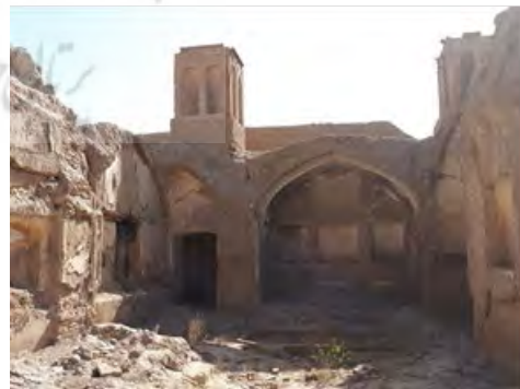
شکل‌های ۷ و ۸. ویرانه‌های به‌جامانده از عمارت خلوت