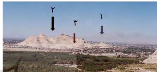
شکل ۲. چشم‌انداز کلی آثار پیرامون باغ بیرم‌آباد

این منطقه عبور می‌کرده و به سمت شهر می‌رفته‌اند. خاک به‌نسبت حاصلخیزتری دارد و پوشش گیاهی آن از نقاط شهر و پیرامون آن غنی‌تر است. در این منظر طبیعی- فرهنگی آثار ارزشمند تاریخی فراوانی استقرار یافته‌اند. قلعه‌های دختر و اردشیر، گنبد جلیه، باغ‌ها و خانه‌های زریسف، قبرستان‌های تاریخی متعدد، تخت درگاه قلی‌بیگ و بند مملکت در این محدوده قرار دارند (شکل ۲).