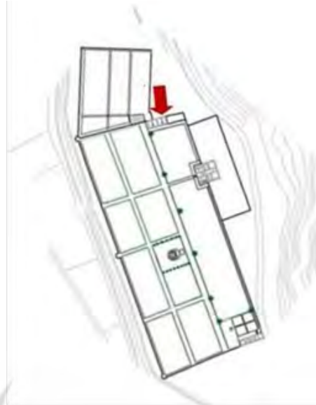
شکل ۵. وضعیت باغ و ورودی آن در دوره گنجعلی خان

شواهد و مدارک نشان می‌دهد که مرمت و توسعه باغ در زمان گنجعلی خان به‌دقت طراحی شده بود تا بیشترین استفاده از محوطه باغ انجام شود. ما نمی‌توانیم ردپای زیادی از طراحی اولیه باغ ببابیم. ویژگی‌های محوطه‌سازی و تک‌بناها از دوره گنجعلی خان (برای مثال سردر ورودی (شکل ۶)) و حوض وسیع دلالت بر این نکته دارد که طرح باغ به چندین محور مشخص تقسیم شده است؛ مانند محل ورود آب (حوض‌خانه)، محل ذخیره آب (آب انبار) و امتداد و خروج آن. عمارت خلوت (حوض‌خانه) که در حال حاضر با آسیب‌های فراوانی مواجه شده (شکل‌های ۷ و ۸)، با توجه به سبک معماری آن و بقایایی از تزئینات معماری موجود در آن، در همین زمان ساخته شده است؛ بنابراین صحن اصلی به‌صورت کلی در دو مرحله و در دوره صفویه ساخته شده است.