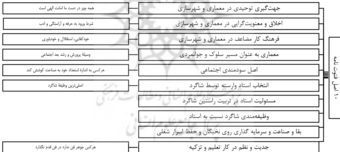
شکل ۳. ۱۰ اصل اخلاق حرفه‌ای در معماری و شهرسازی، برگرفته از (Agasharifiane Esfahani, 2013, PP. 85-95)

(Agasharifiane Esfahani, 2013, P. 85). جایگاه اخلاق در معماری در سه حوزه وحدانیت، انسانیت، و طبیعت به چشم می‌خورد و همان طور که گفته شد از نخستین منابع مکتوب پیرامون رعایت اصول اخلاقی در فرایند ساخت آثار معماری فتوت‌نامه‌ها است. به‌طور مثال وقتی بنایان از داربست بالا می‌روند، به خانه همسایه نگاه نکنند (Pourmand, Bemanian, Mahdavejrad, & Samadzadeh, 2015, P. 24). با مطالعات انجام شده، در آموزش سنتی معماری، آموزش با یادگیری فن ساختمان‌سازی پایان نمی‌یابد، در این مرحله، یادگیرنده، اخلاقیات را نیز می‌آموزد. با بررسی فتوت‌نامه‌های مرتبط با معماری و صنعت ۱۰ اصل اخلاق حرفه‌ای به‌دست آمده که در شکل ۳ بیان شده است و می‌تواند بر آموزش معماری به‌طور کامل اثر گذارد.