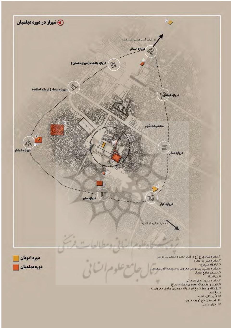
شکل ۳. شهر تاریخی شیراز (محدوده شهر و عناصر ارزشمند آن در دوره دیلمیان)