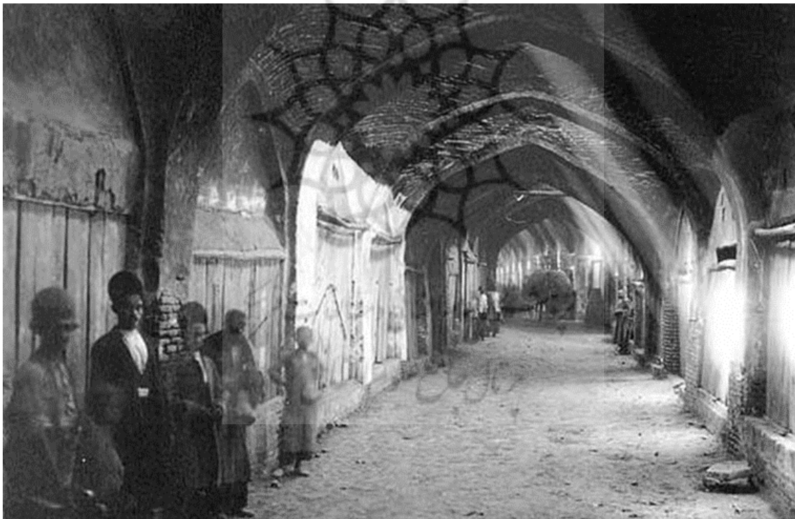
شکل ۱۰. مسجد وکیل

عمارت نوبنیاد وکیل در شمال شهر قرار دارد و شامل قسمتی از محلات در شاهزاده و میدان‌شاه است که پس از