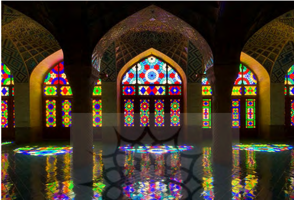
شکل ۱۱. مسجد نصیرالملک شیراز

در شرف خرابی و انهدام است... در فاصله یک‌چهارم مایلی شمال دروازه شاه میرحمزه بنای بزرگ هشت‌ضلعی وجود