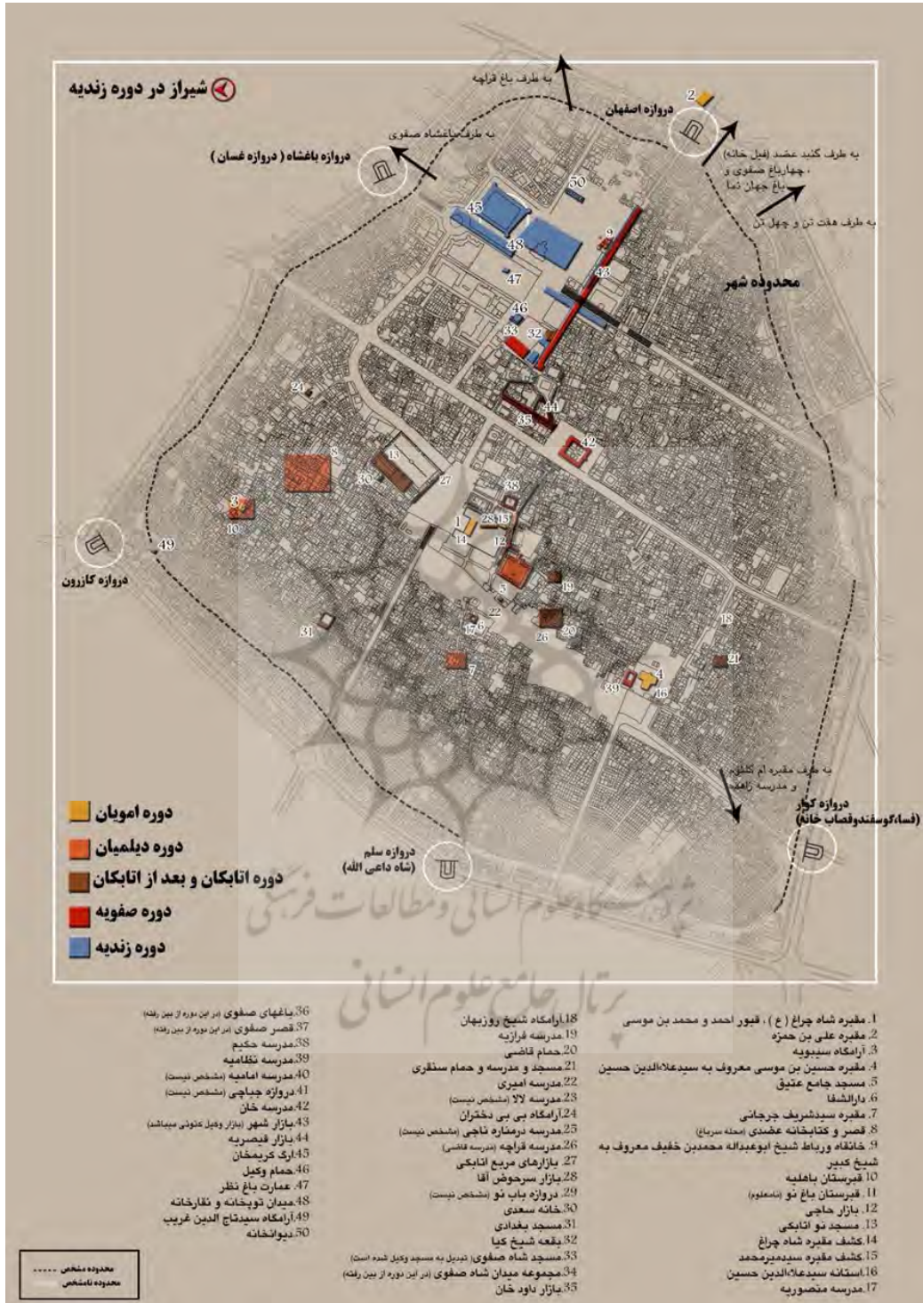
شکل ۶. شهر تاریخی شیراز (محدوده شهر و عناصر ارزشمند آن در دوره زندیه)