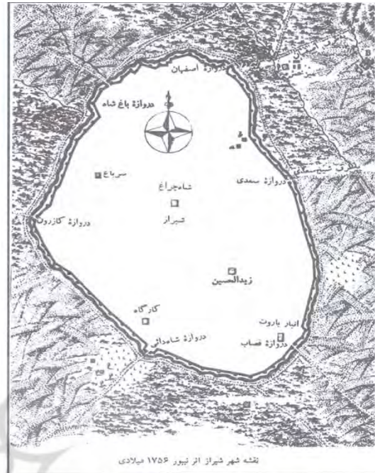
شکل ۱۶. نقشه شهر شیراز اثر نیبور ۱۷۵۶ میلادی منبع: Niebuhr, C. (1774-1778).

مذهبی و تجاری شهر حول میدان مرکزی مشرف به ارگ کریم‌خان، نوع جدیدی از سازمان‌دهی عناصر و عملکردهای عمومی شهر را مطرح نموده است (شکل‌های ۱۲ و ۱۳). این میدان شهری در دوره قاجار نیز از اهمیت فوق‌العاده‌ای برخوردار بود و عملاً مرکز حکومتی شهر به شمار می‌رفت. این مرکز و میدان حکومتی در مواجهه با میدان مشرف به مجموعه مذهبی شاه‌چراغ (ع) و مسجد نو، فعالیت‌های اجتماعی فرهنگی، دیوانی و مذهبی شهر را در دو قطب شمالی و جنوبی سازمان‌دهی می‌کردند که این ویژگی در نوع خود کم‌نظیر است و در این هماهنگی مجموعه زنده از ویژگی ممتازی برخوردار بود. وجود عناصر ارزشمند این مجموعه تاریخی-فرهنگی و بقای آنها تا دوره معاصر این امکان را به وجود آورده است که با توجهی جدی و طی فرایند مرمت فضای تاریخی شهر، بتوانیم با بهره‌مندی از ظرفیت‌های هویتی، فرهنگی و اجتماعی آن شاهد بازآفرینی مرکز تاریخی شهر در این محدوده باشیم.