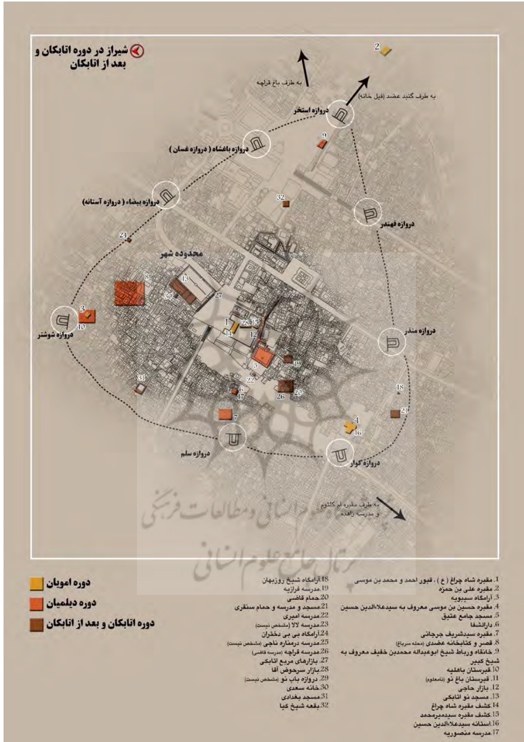
شکل ۴. شهر تاریخی شیراز (محدوده شهر و عناصر ارزشمند آن در دوره اتابکان و پس از آن)