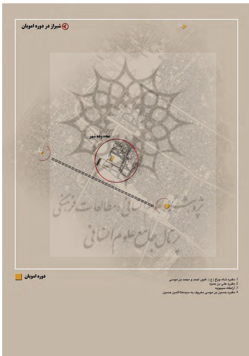
شکل ۲. شهر تاریخی شیراز (محدوده شهر و عناصر ارزشمند آن در دوره خلافت امویان)

سیمای کلی شهر در این زمان، شامل دارالاماره و چندین مسجد و بازاری است که حول اصلی‌ترین مسیر عبوری آن (به طرف استخر) شکل می‌گیرد. از محل مسجد و دارالعماره و محدوده مسکونی شهر در آن دوران، اطلاعی در دست نیست، ولی احتمال می‌رود جای شهر و مسجد در همین حوالی (مرکز شهر تاریخی) بوده باشد؛ زیرا در گذشته بر روی