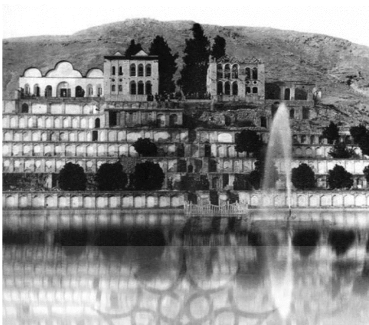
شکل ۱۳. باغ تخت شیراز