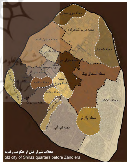
شکل ۱۴. محلات شیراز قبل از حکومت زندیه