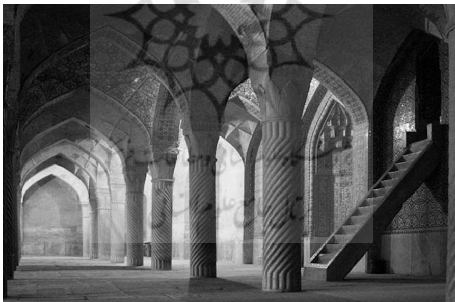
شکل ۹. بازار وکیل

و بسیار عمیق به دور آن حصار استوار حفر کردند (Rajaei, 2005, PP. 319-320). ساختمان‌های کریم‌خان که عبارت از بازار (شکل ۹)، مسجد (شکل ۱۰)، آب‌انبارها، دیوان‌خانه، میدان، ارگ (شکل ۸)، اندرون، مدرسه، باغ حکومتی و