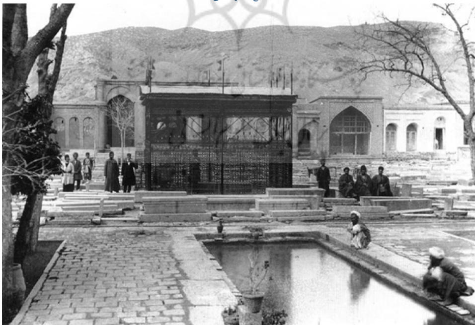
شکل ۱۱. آرامگاه حافظ پیش از ۱۳۱۵