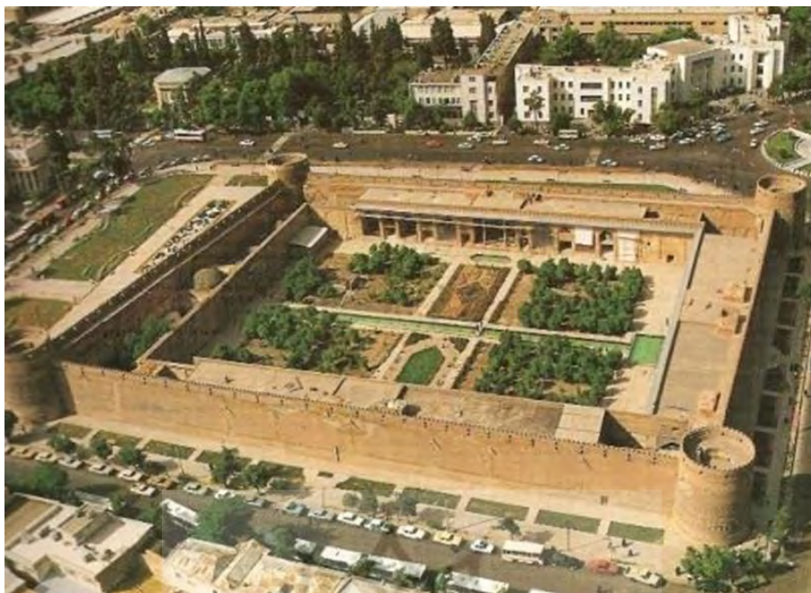
شکل ۸. ارگ کریم‌خانی