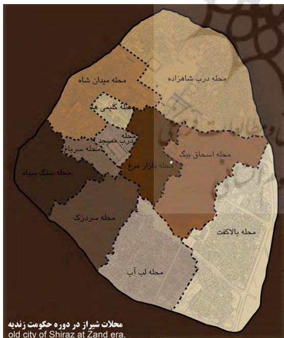
شکل ۱۵. محلات شیراز در دوره حکومت زندیه