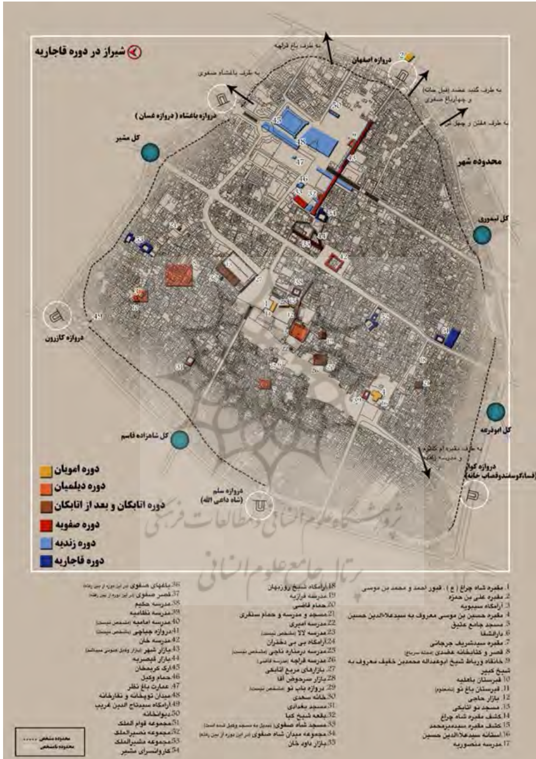
شکل ۷. شهر تاریخی شیراز (محدوده شهر و عناصر ارزشمند آن در دوره قاجاریه)