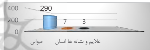
شکل ۳. جامعه آماری تعداد نگاره‌ها

در بررسی نگارندگان از محوطه خانم علیلو، حدود ۷۰ تخته‌سنگ دارای نقوش شناسایی و مستندنگاری شد. نقش‌مایه در ۳ دسته حیوانی (بز، اسب، حیوان وحشی) ۲۹۰ انسانی (پیاده و سوارکار) تعداد ۷ علائم و نشانه ۳ نقش قابل‌دسته‌بندی است (شکل ۳). نقش‌مایه حیوانی به‌خصوص بز همانند سایر مناطق شناسایی‌شده در سایر مناطق و به‌خصوص شمال غرب ایران، بیشترین تعداد را دارد. گفتنی است هریک از این گونه‌ها، به زیرگروه‌هایی قابل‌دسته‌بندی بوده که مطالعات تطبیقی با محوطه‌های شناسایی‌شده در سایر مناطق شمال غرب ایران شباهت‌های میان آنها را قابل‌مشاهده کرده است.