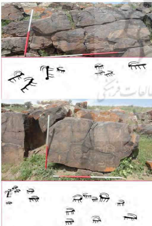
شکل ۴. نمونه‌ای از نگاره بز در محوطه خانم علیلو