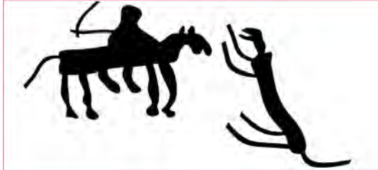
شکل ۵. نمونه‌ای از نگاره انسانی در سنگ‌نگاره‌های خانم علیلو