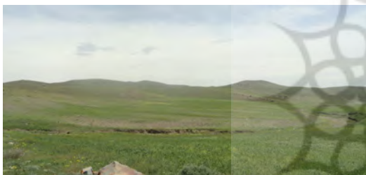
شکل ۲. دورنمایی از محوطه خانم علیلو

تمامی این نگاره‌ها به روش کوبشی و با واردآوردن ضربه‌های متوالی، یا ایجاد خراش با جسمی تیز بر بدنه سنگ در اثر کوبیدن سنگ ایجاد شده‌اند. برخی از نقش‌ها با همین روش، اما به صورت توپر اجرا شده‌اند. اندازه خطوط نگاره‌ها از ۱/۵-۱ میلی‌متر متغیر است. عمق و تفاوت رنگ و چگونگی فرسایش نقش‌ها از جمله عواملی هستند که می‌توانند در گاه‌نگاری و تقدم و تأخر ایجاد نگاره‌ها مورد نظر قرار بگیرند. عمق و رنگ نقش‌ها حتی برخی که در یک صحنه قرار دارند، با یکدیگر متفاوت هستند؛ بدین صورت که عمق برخی به علت مرور زمان و تأثیر عوامل طبیعی به قدری فرسایش یافته که تقریباً با صخره هم‌سطح شده، یا اینکه سطح برخی دیگر با زمینه صخره هم‌رنگ شده و به راحتی قابل رؤیت نیستند. این تغییر رنگ نگاره‌ها، عموماً نشانگر تقدم و تأخیر نقش‌هاست.