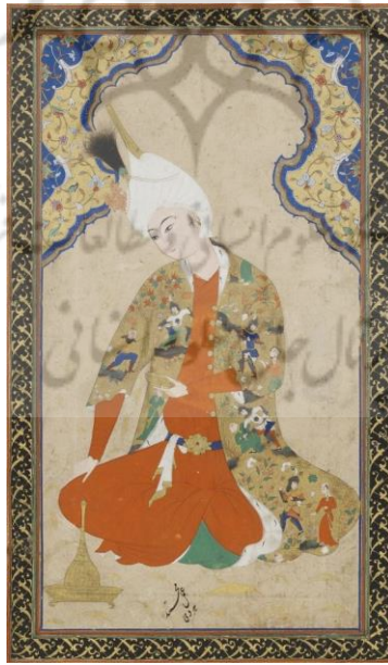
الصورة ١_٢_٤ : الأمير الشاب، محمد هرفي، القرن العاشر الهجري، الفترة الصفوية، مدرسة تبريز، معرض واشنطن الحر ، Metmuseum.org