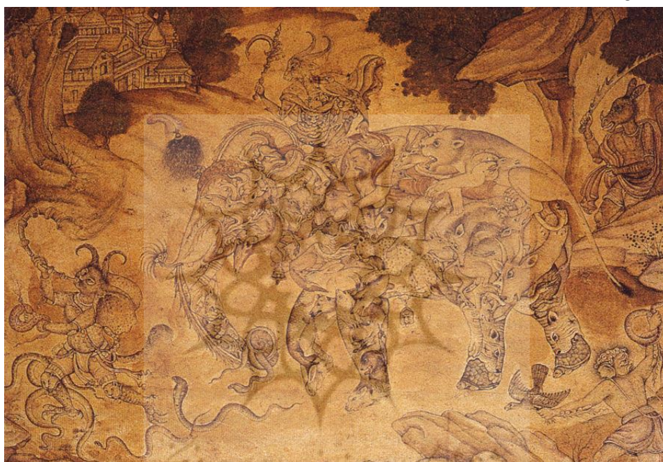
الصورة ٣_٤_١: فيل مجّع، ١٥٩٠ م / ٩٦٩ هـ، القرن العاشر الهجري، عصر غورخانيدي متحف آغا خان، أجرا الهند ،