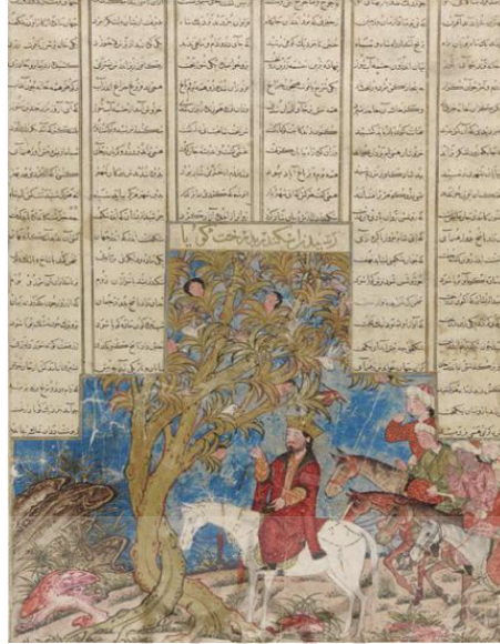
الصورة ١-١-٤، وصول الإسكندر إلى شجرة غويا، شاهنامه دهبو، ٧١٠ هـ، إيلخانز، فريز غاليري، واشنطن،