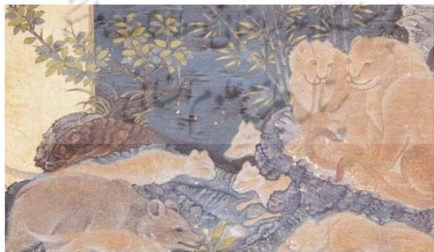
الصورة ٢-١-٤، روكس، كليله ودمنه، جلايريان، ٧٥٤ هـ، جامعة اسطنبول، تركيا، Kutuphane.Istanbul.edu.tr.

كما أنّ صورة مزيج الصخور مع وجوه الحيوانات والبشر في كتاب كليله ودمنه في فترة الجلايري في النصف الثاني من القرن الثامن الهجري (الصورة ٢-١-٤) (نايفي، ٢٠١٢ : ٢٠). في هذه الصورة، تتشكل أشكال الحيوانات الصغيرة داخل جسم طبيعي مثل: الصخور لتكوين صورة شاملة. لكن هذه الأمثلة ليست هي الموضوع الرئيس للرسم أو ليست في وسطها، ولكنها لعبت دورها في الهامش وفي خلفية الموضوع الرئيس.