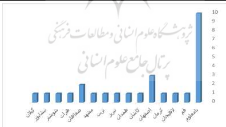
نمودار ۲: خاستگاه و پراکندگی شهری نگارگران در تذکره‌ها