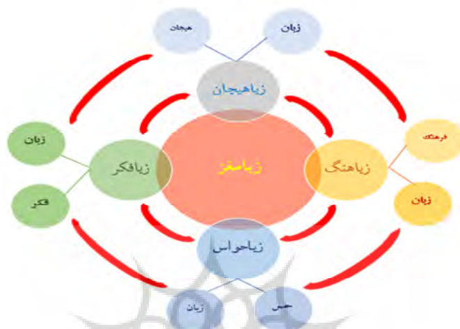
شکل ۱: الگوی زیامغز (پیش‌قدم و ابراهیمی، ۱۳۹۹، ص. ۹)