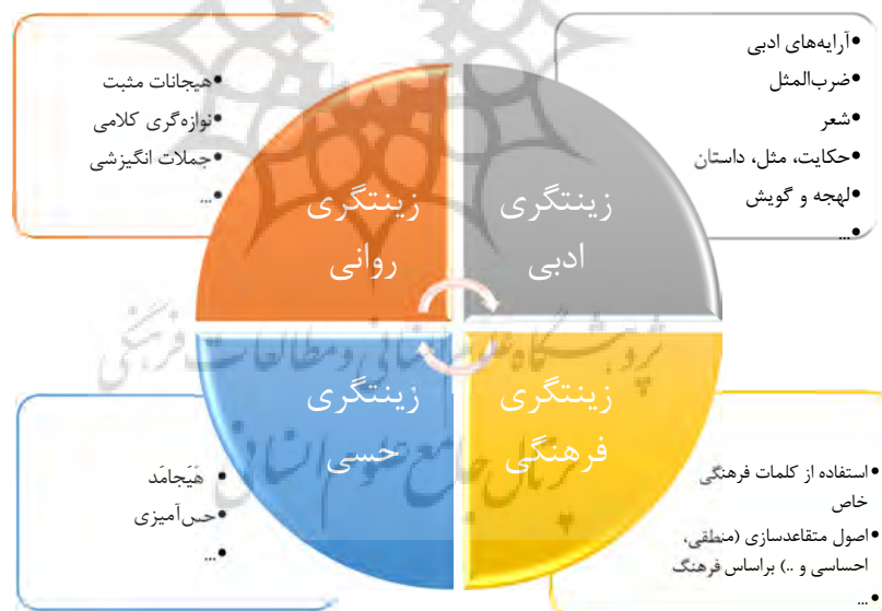
شکل ۳: انواع زینتگری زبانی

درگیر کند و هم‌افزایی حواس در آن مشاهده می‌شود. بنابراین، برای زینتگری حسی باید به واژگانی توجه داشت که هم‌زمان می‌توانند حس آمیزی و هم‌افزایی حسی بیشتری به دنبال داشته باشند. در جمله «توقف بیجا مانع کسب است» واژه «توقف»، حس لمسی و ایستایی را به ذهن متبادر می‌سازد که می‌تواند با جمله «از شما که با خرید سریع خود به رونق بیشتر این فروشگاه کمک می‌کنید، صمیمانه سپاسگزاریم» جایگزین شود. در جمله دوم، به جای واژه انتزاعی «کسب»، واژگان «خرید سریع» و «فروشگاه» جایگزین شده است که می‌تواند تصویر آن‌ها را هم‌زمان برای فرد یادآوری کند. از سوی دیگر، «سپاسگزاری» در این جمله واژه‌های احساسی و اجتماعی است که حس و هیجان مثبتی را به مخاطب منتقل می‌سازد. به عبارت دیگر، حس ایستایی واژه توقف با حس حرکتی خرید سریع جایگزین شده است و حس پویایی را در مخاطب ایجاد می‌کند. بنابراین، براساس آنچه ذکر شد انواع زینتگری زبانی و راهکارهای مربوط به آن را می‌توان در شکل ۳ به صورت خلاصه به تصویر کشید: