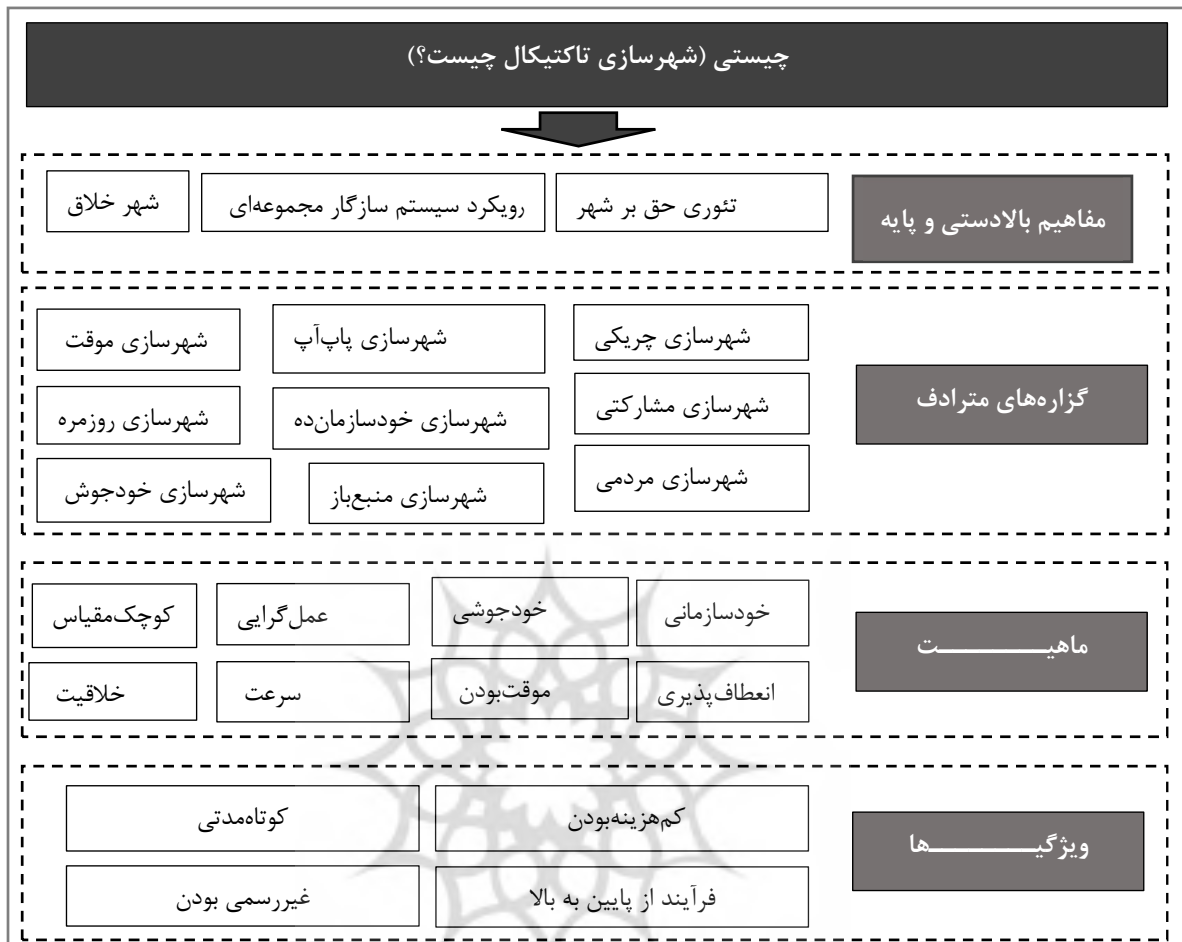
تصویر ۲. خلاصه کدها و تم‌ها در مقوله «چیستی» شهرسازی تاکتیکال

پژوهشگاه علوم انسانی و مطالعات فرهنگی رتال جامع علوم انسانی